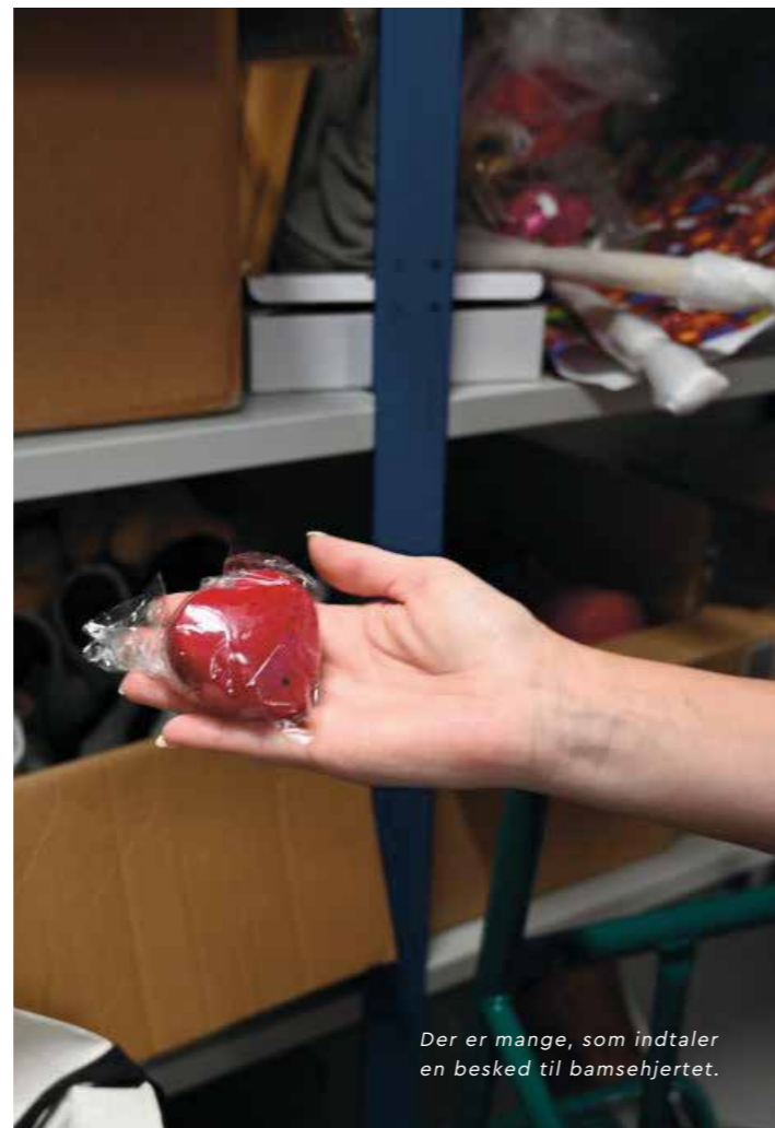
Der er mange, som indtaler en besked til bamsehjertet.