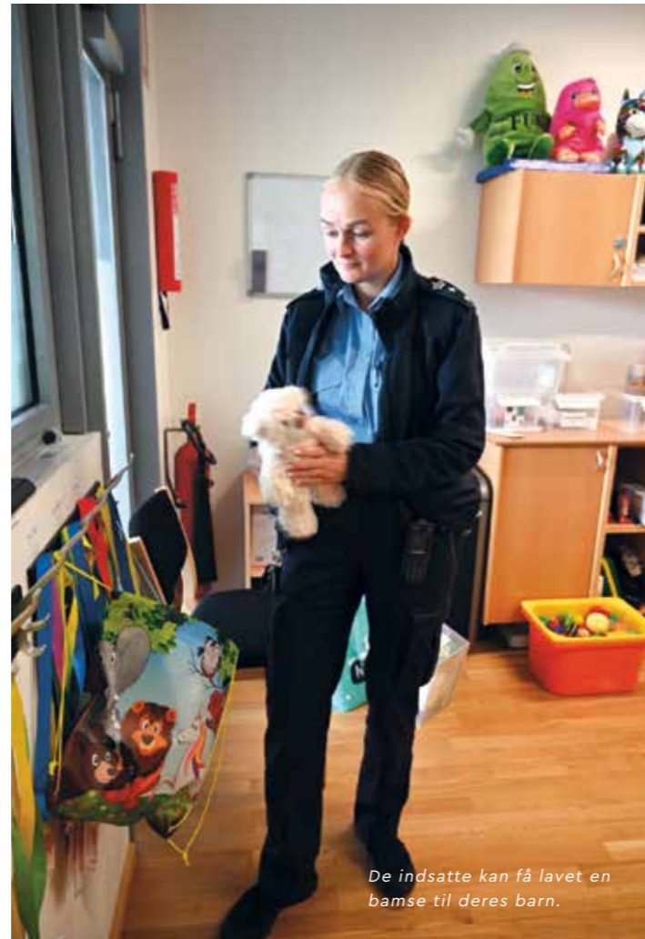
De indsatte kan få lavet en bamse til deres barn.