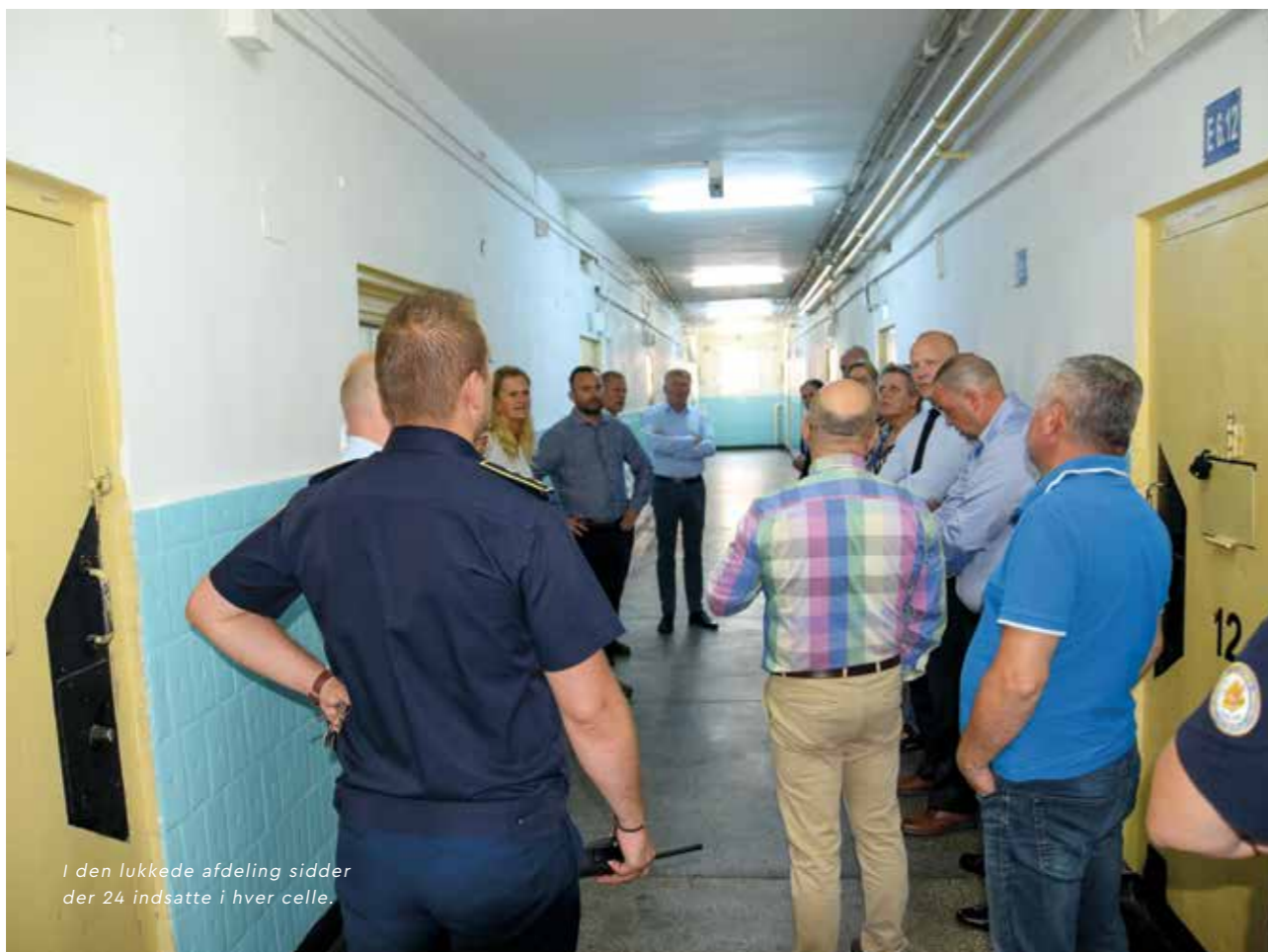
I den lukkede afdeling sidder der 24 indsatte i hver celle.

OPFATTELSEN AF RUMÆNSKE FÆNGSLER SOM DET VÆRSTE AF DET VÆRSTE SKAL MÅSKE REVURDERES. PÅ OVERFLADEN VIRKER RAHOVA FÆNGSEL I BUKAREST I HVERT FALD SOM ET FREDeligt STED