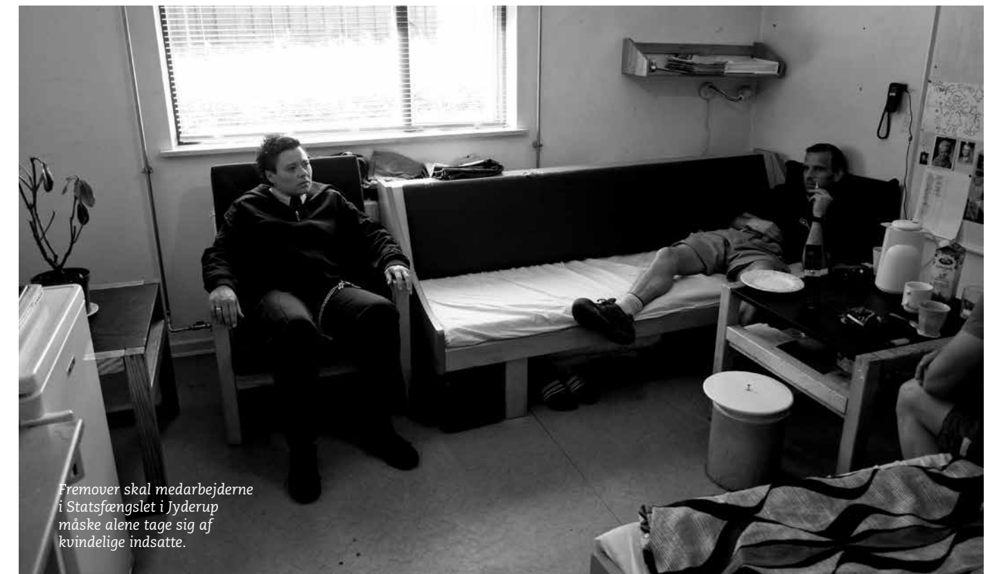
Fremover skal medarbejderne i Statsfængslet i Jyderup måske alene tage sig af kvindelige indsatte.

"Når så mange kvinder rapporterer om sexchikane i vores fængsler, må vi gribe ind politisk. Kvinderne kan jo ikke som ude i samfundet bare gå og holde sig ude af det. Derfor bliver det en politisk opgave at sikre den fornødne beskyttelse gennem etablering af et eller flere kvindefængsler," siger hun. →