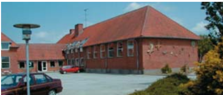
Lunde Uddannelsescenter på Fyn.

afspejle den samarbejdssituation man møder i et fængsel eller et arresthus, hvor evnen og viljen til at løse opgaverne i fællesskab er i fokus, da de fleste opgaver eller prøvelser man bliver udsat for, ikke kan løses alene. Samarbejde er helt nødvendigt.