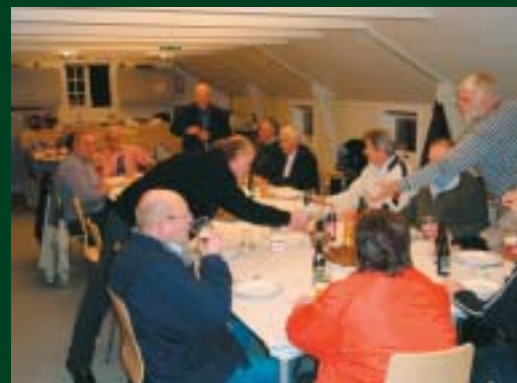
Mad og drikke langes rundt.