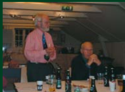
Lerche i showmode.