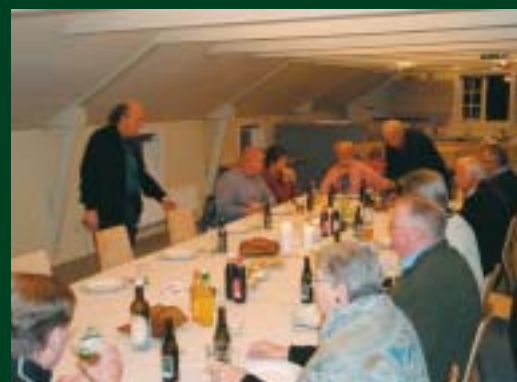
Maden sættes på bordet.