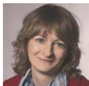
Line Barfod (Enhedslisten):

"Arbejdsmiljøet skal indtænkes i alt. Det handler om uddannelse, uddannelse og uddannelse – til de indsatte, det vil forbedre arbejdsmiljøet for de ansatte. Desuden er hele sikkerhedsdiskussionen vigtig, som en del af de ansattes arbejdsmiljø, og igen er det vigtigt, at de indsatte får noget at rive i og begynder at tænke over egne ressourcer – det vil give et fuldstændigt skift i arbejdsmiljøet."