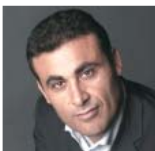
Naser Khader (Ny Alliance):

"Der er behov for et massivt løft, der er rigtig meget, der halter – både forholdene for de ansatte, indsatte og bygningsmassen. Der er ekstremt behov for en uddannelsesreform for de ansatte. Der skal være mere teori, psykologi og konflikthåndtering. Vi skal have løftet de ansattes muligheder for uddannelse. Den resocialiserende indsats for de indsatte skal være i orden, de skal bruge tiden fornuftigt og have mulighed for uddannelse."