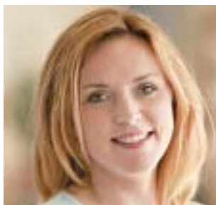
Karen Hækkerup (Socialdemokraterne):

"Vi lægger vægt på, at arbejdsmiljøet bliver bedre i fængslerne til fordel for fængselsfunktionærerne. De har et hårdt arbejde, og rapporter samt erfaringer tyder på, at det er for hårdt. Det er ikke holdbart, at man på nogle vagter er alene. Lederuddannelsen og fængselsfunktionærernes uddannelse skal forbedres. Grunduddannelsen skal være længere og mere grundig inden for emner som konflikthåndtering. Og så skal vi have en højere grad af sikkerhed, så fangeflugter ikke er mulige. Hvis disse initiativer skal gennemføres, bliver det nødvendigt at sætte flere penge af til området."