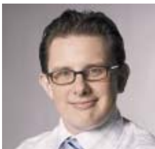
Simon Emil Ammitzbøll (Det Radikale Venstre):

des i dag, og de ansatte skal være bedre rustede. Medarbejderne skal samtidig uddannes, så de kan gå videre ud i andre fag, så de ikke kun har mulighed for at være fængselsfunktionærer resten af livet. Der skal rekrutteres bredere, så de ansatte har forskellige baggrunde - nogle for eksempel med en mellemlang uddannelse. Det stiller krav til lønnen. Der skal være bedre leder- og efteruddannelse for alle. De indsatte skal have mere uddannelse, og der skal mere fokus på Kriminalforsorgen i Frihed."