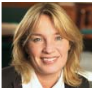
Justitsminister Lene Espersen (Konservative):

vil betyde, at personalet bliver bedre til at håndtere konflikter. Vi er nødt til at få sænket konfliktniveauet, så personalet får et godt arbejdsmiljø. De indsattes uddannelsesforhold skal også forbedres, og de skal være bedre rustede til at komme ud."