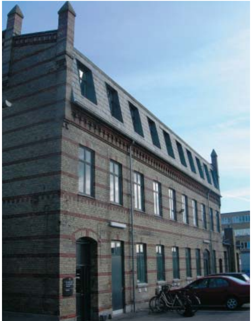
KRIS-Danmarks værested på Dortheavej i København huser 14 beboere. De følger daglig undervisning i at komme ud af de kriminelle tankemønstre.