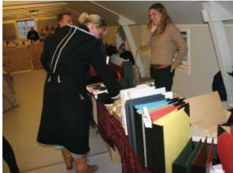
Bogbinderiets produkter blev nøje studeret.