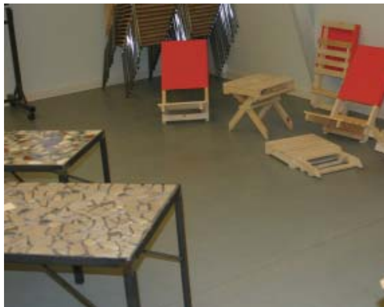
Mosaikborde og strandstole var også en del af udvalget.