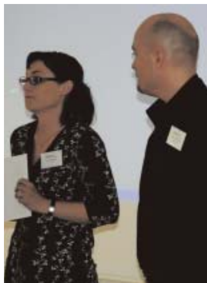
Formand og næstformand i SAVN.