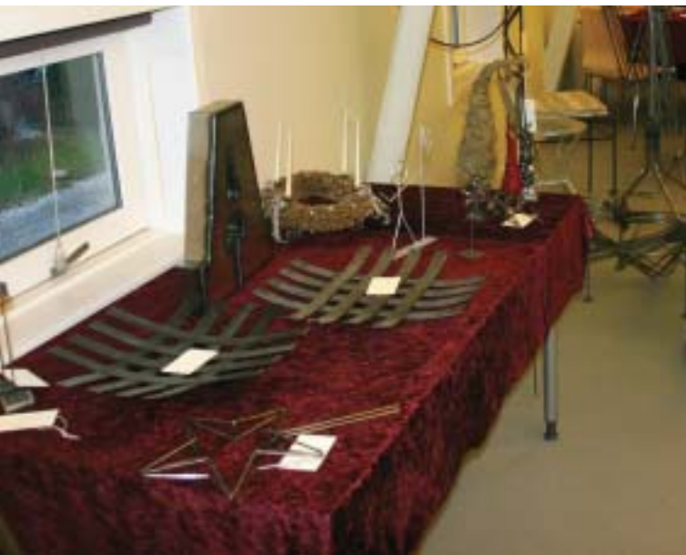
De mange pæne produkter i metal vises frem.