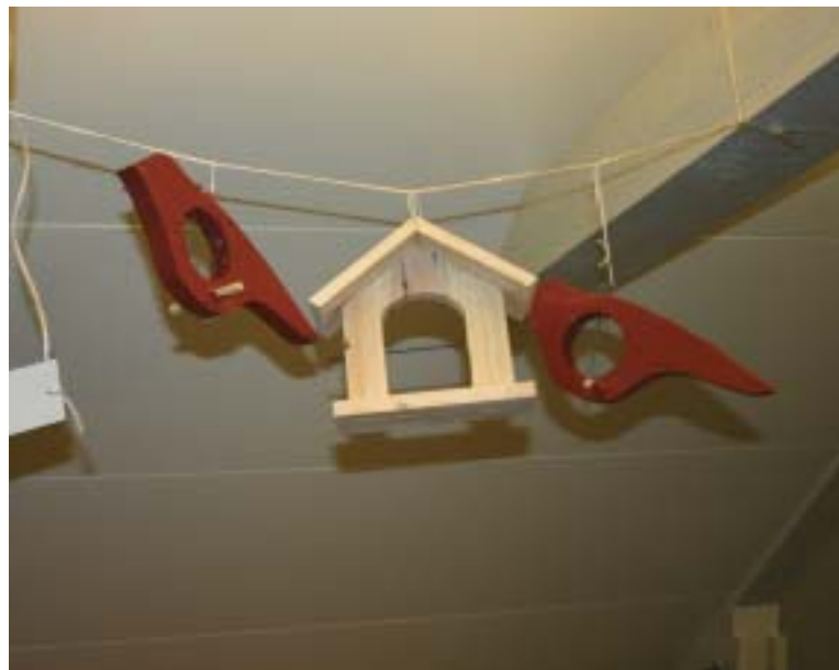
Ophæng i træ til fuglefoder bliver måske årets store julegavehit?