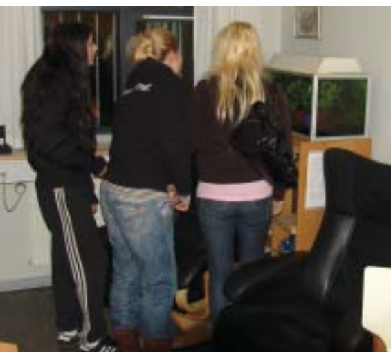
Personalet på sygeafdelingen holder også fisk i fangenskab.

Rundvisningen på værkstederne var koncentreret om de tre store områder: Skrædderiet, de grafiske fag og montageværkstederne. Hvert sted var der en værkfører, som fortalte om finurlighederne ved lige netop hans, eller hendes, værkstedsområde, og de besøgende fik tydeligt en fornemmelse af, at de lige nu befandt sig i fængslet bedste og mest betydningsfulde område med arbejdsopgaver, der er så krævende, at man helst ansatte livstidsfanger, for at kunne nå at lære dem op og få lidt udbytte af deres arbejdskraft inden løsladelsen stod for døren igen.