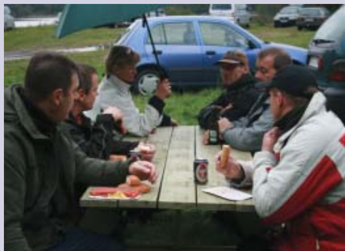
Pause i fiskeriet med pølser.