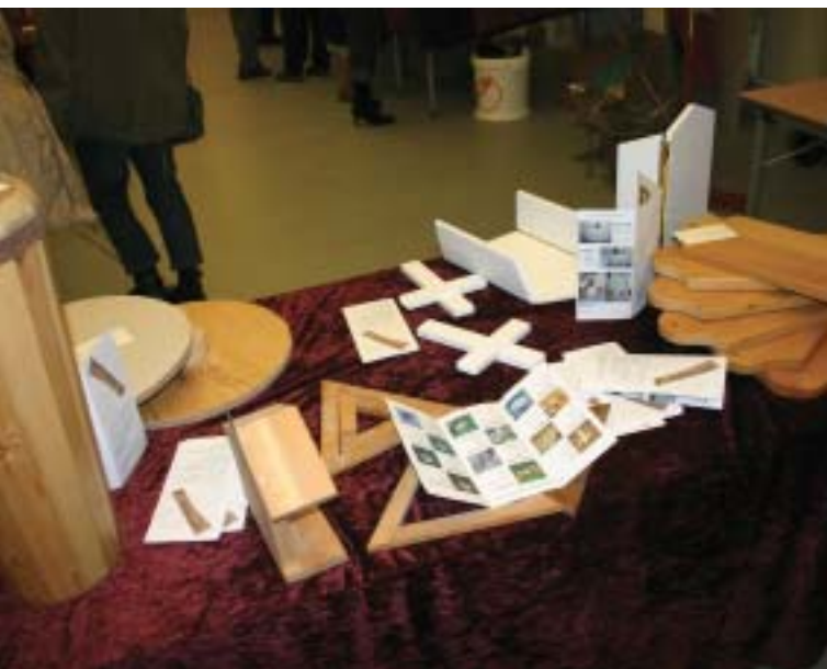
Blandt produkterne i træ kunne man finde alt fra bordskåner og skærebrætter til bongotrommer og altertavler.