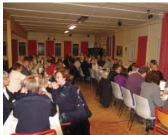
Gæsterne nyder kaffen og kagen inden rundvisningen.