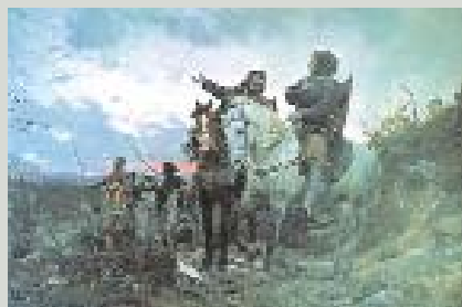
Otto Baches billede fra 1882 ved navn " De sammensvorne rider fra Finderup lade".