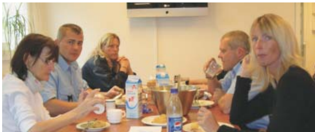
Arresthuset er ikke større end, at alle mand på vagt kan spise frokost ved samme bord.