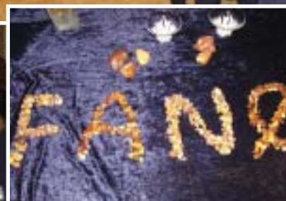
Fanø præsenteret i rav.