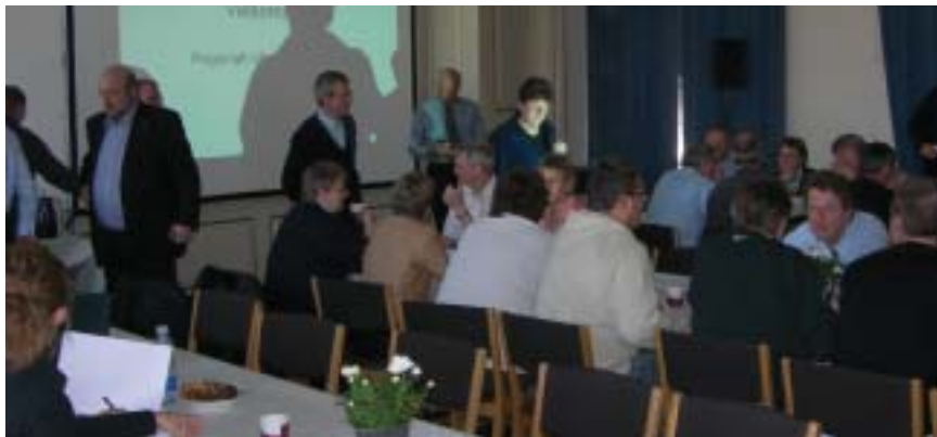
Riddersalen i Statsfængslet på Søbysøgård var ramme om første stop på Rentzmann & Østerbyes rundtur i landet.

På informationsmødet, hvor der var deltagere