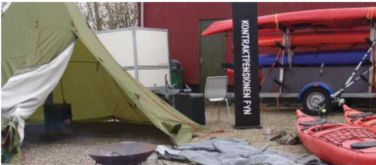
Lejrlivets lyksaligheder kan opleves på Kontrakt pension Fyn

Den 15. marts 2007 var der nærmest markedsstemning ved idrætsforeningens lokaler ved Statsfængslet i Nyborg. Kriminalforsorgens pensioner havde indbudt til pensionernes dag, hvor de præsenterede sig selv og deres tilbud til andre institutioner i Kriminalforsorgen.