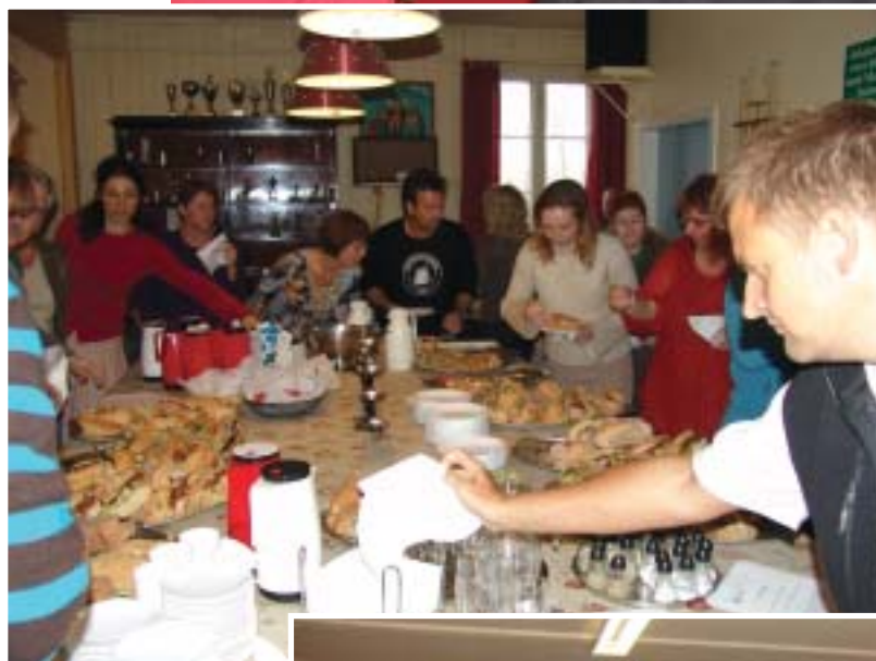
Kaloriebuilding Samarbejde eller alle mod alle.