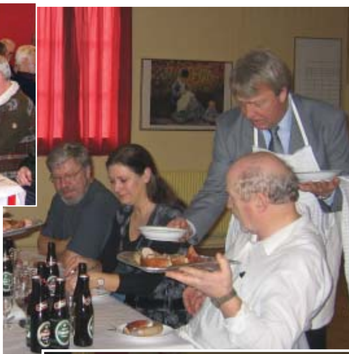
Inspektøren viser sig som en habil tjener. Mon han kan lejes til private fester?