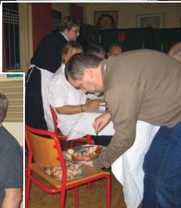
Til gengæld kører det vist ikke helt for beskæftigelseslederen.