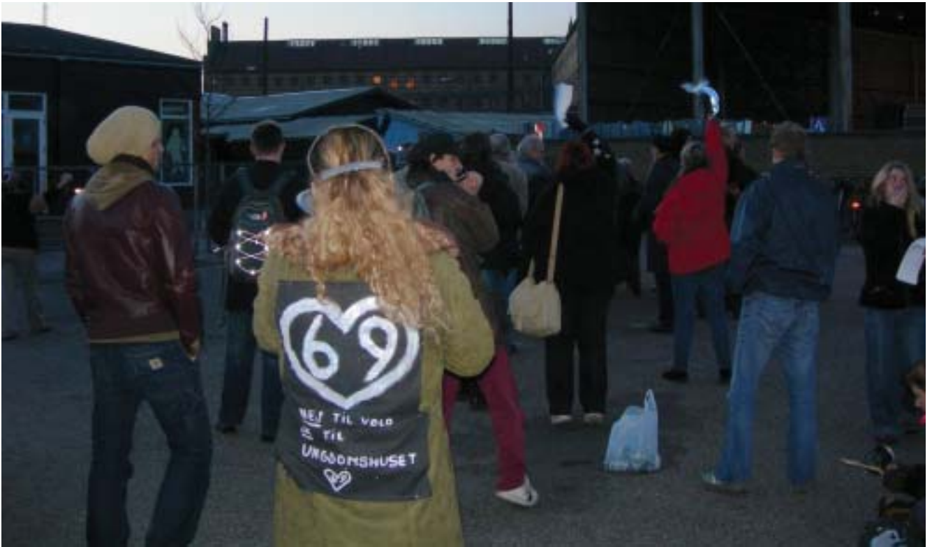
"Befri de politiske fanger!" Venner til de indsatte demonstrerede foran Vestre Fængsel.