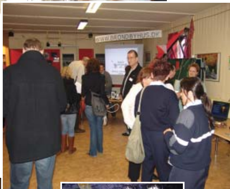
Travlhed ved standene. Der er nok at se på.