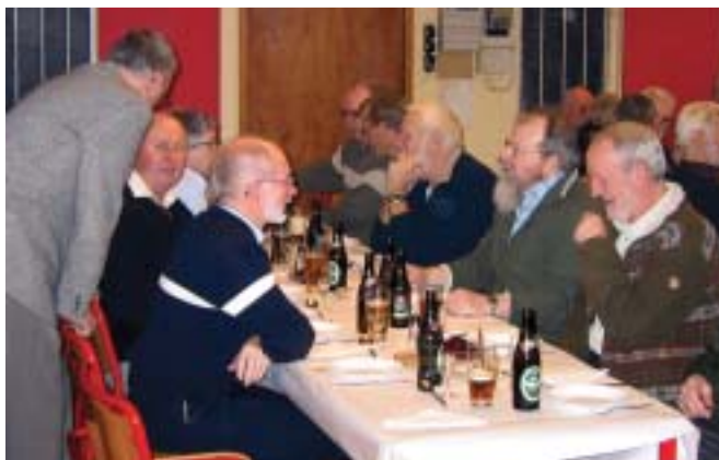
"Kan i huske dengang..?" De gode historier kommer frem.