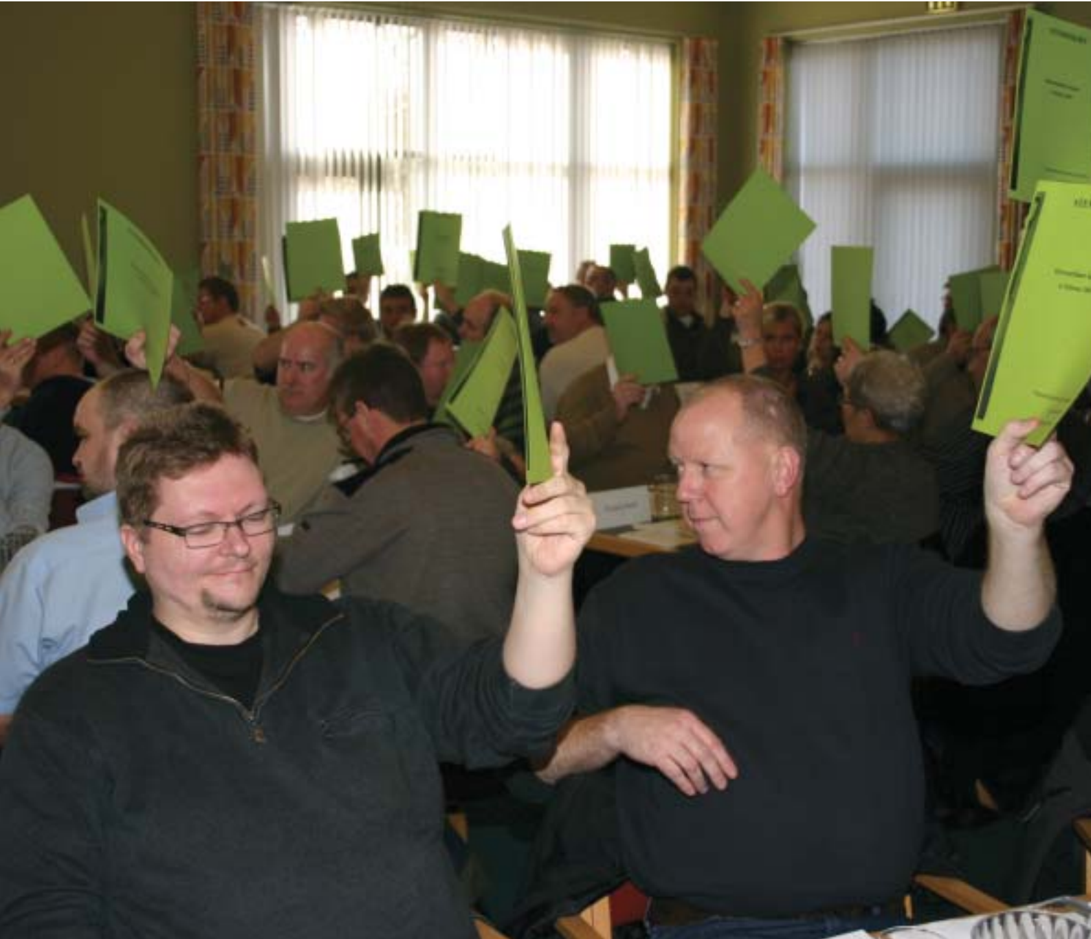
Den ny strukturmodel blev enstemmigt vedtaget af kongressen.

bliver mangeartede såvel i forhold til alle medlemmer af forbundet som de sektioner, de kommer fra. De skal styre udvalg om for eksempel flerårsaftale, ny løn og arbejdsmiljø. Samtidig får de sagsbehandlingsopgaver for de enkelte afdelinger, for eksempel at bistå med at håndtere konflikter. Og endelig bliver de et vigtigt bindeled mellem forbundsledelse og afdelinger."