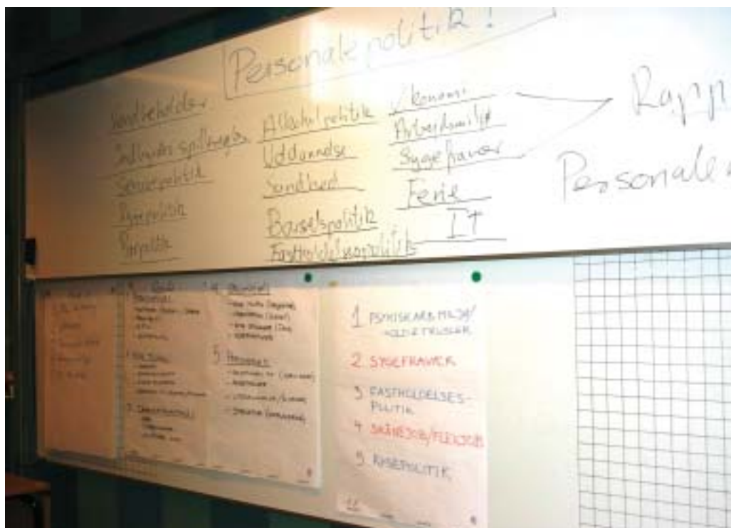
Tavle og plancher bliver flittigt brugt, når der fokuseres på emnet personalepolitik.

En del af tillidsrepræsentantkurset er tilrettelagt som gruppearbejde for deltagerne.