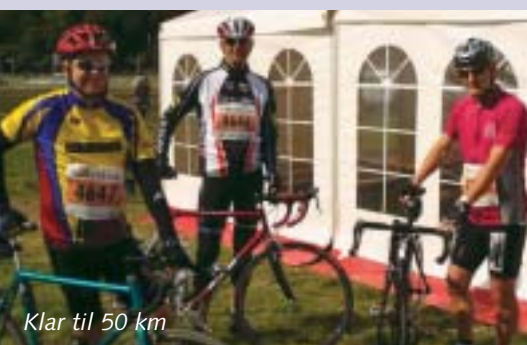
Klar til 50 km