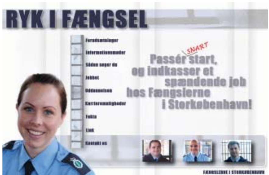
Ny hvervekampagne skal skaffe flere folk til fængslerne i København.

Han understreger, at han på det seneste har skubbet hårdt på Direktoratet for Kriminalforsorgen for at sætte en stærkere rekrutteringsindsats i gang.