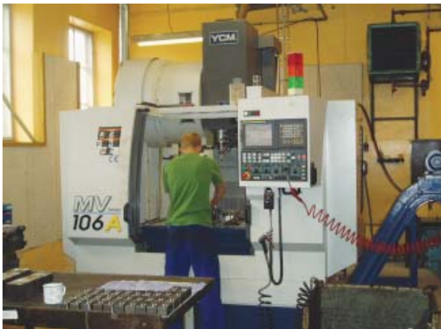
Nyt jobprojekt har skaffet arbejde til 30 tidligere indsatte på Fyn og i Trekantsområdet. Blandt andet arbejde som maskintekniker.

at DR2 har videreformidlet de gode resultater i en tv-udsendelse i starten af oktober.