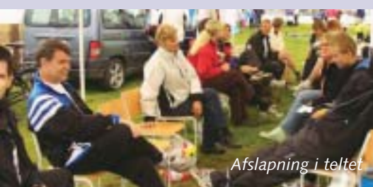
Afslapning i teltet