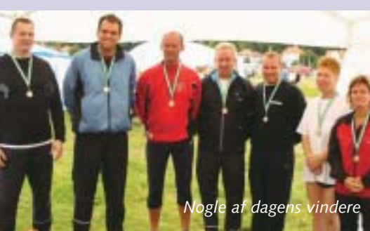
Nogle af dagens vindere