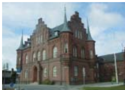
Hvem skal lede arresthusene, når politimestrene slipper tøjlere?

restforvarerne, er enig: "En fremtid, hvor vi er underlagt fængslerne, er et skrækscenarium. Vi er bange for en lillebrorefekt, hvor fængselsinspektørerne ikke giver arresthusene opmærksomhed. For eksempel risikerer vi, at fængselsinspektørerne pålægger os vanskelige fanger og flere strafafsonere – uden at vi kan melde fra."