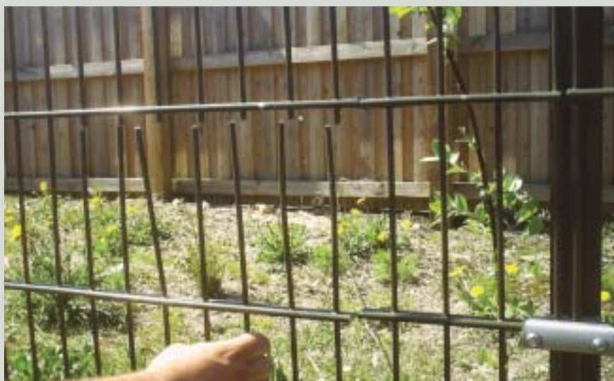
Hollænderhegnet efter besøg af boltsaks.

En nydelse at se, hvor godt personalet arbejdede – men det må altså godt vare længe inden lokummet brænder