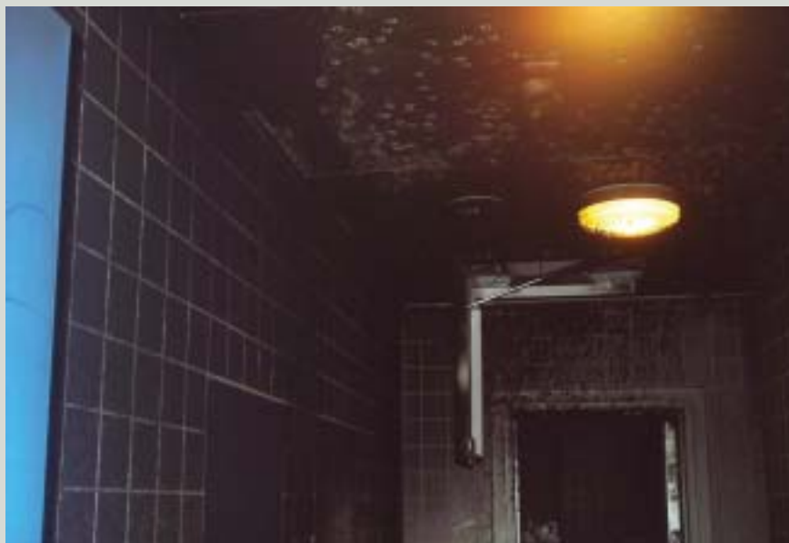
Et baderum efter branden.

Mens en funktionær løb ind efter håndjern, gik brandalarmen. Personalet kunne herefter høre, hvordan de indsatte i afdelingen blev mere og mere ophidsede. De bankede på vinduerne, råbte at det brændte og begyndte at smadre vinduer og inventar. Tre kolleger gik ind til fløjen via gårdtursarealet og kunne straks se, at der var røg på gangen. De fik åbnet døren og begyndte at evakuere de indsatte. Der var sytten indsatte tilbage på afdelingen, der var påsatte brande på begge badeværelser og i en affaldsspand på gangen. Ikke alle indsatte var glade for betjentenes ankomst, og