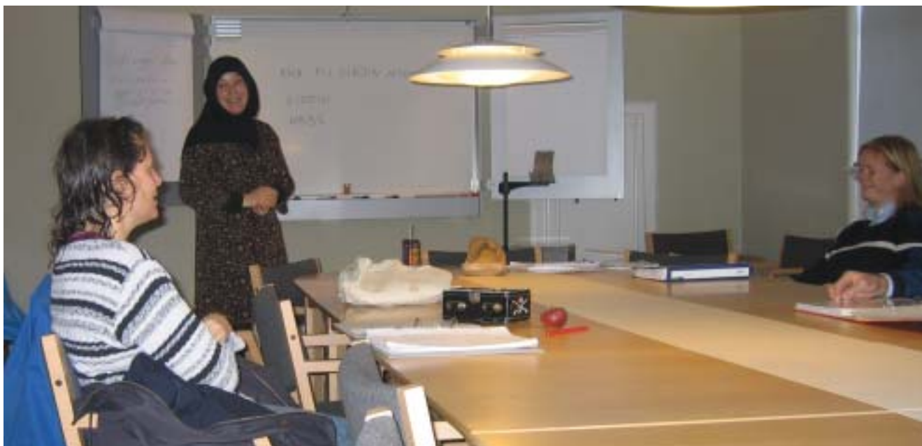
Det gælder om at høre efter.