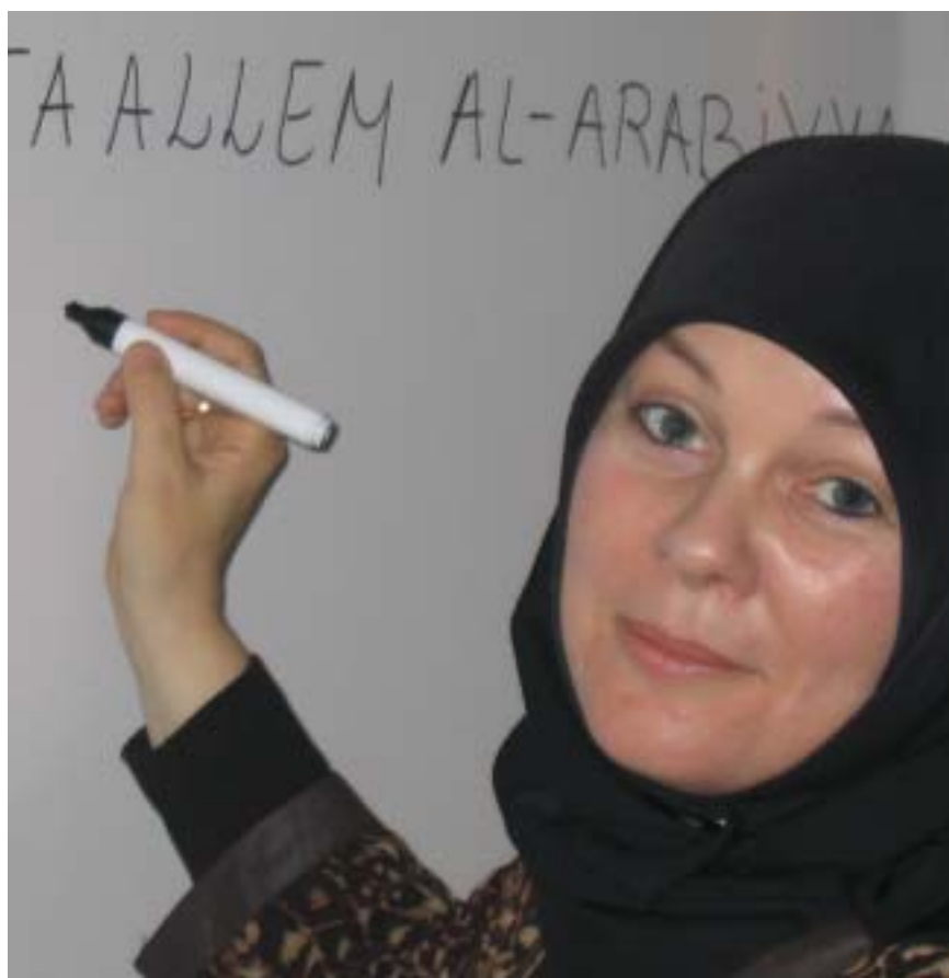
Underviseren i aktion.

Inspektøren i Nyborg var særdeles lydhør overfor ideen og en henvendelse til Center for Mellemøst-studier ved