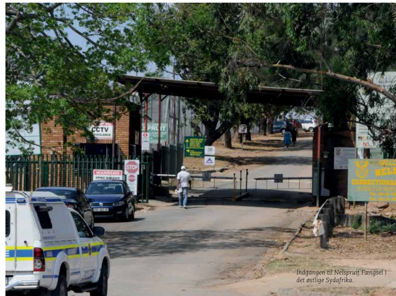
Indgangen til Nelspruit Fængsel i det østlige Sydafrika.