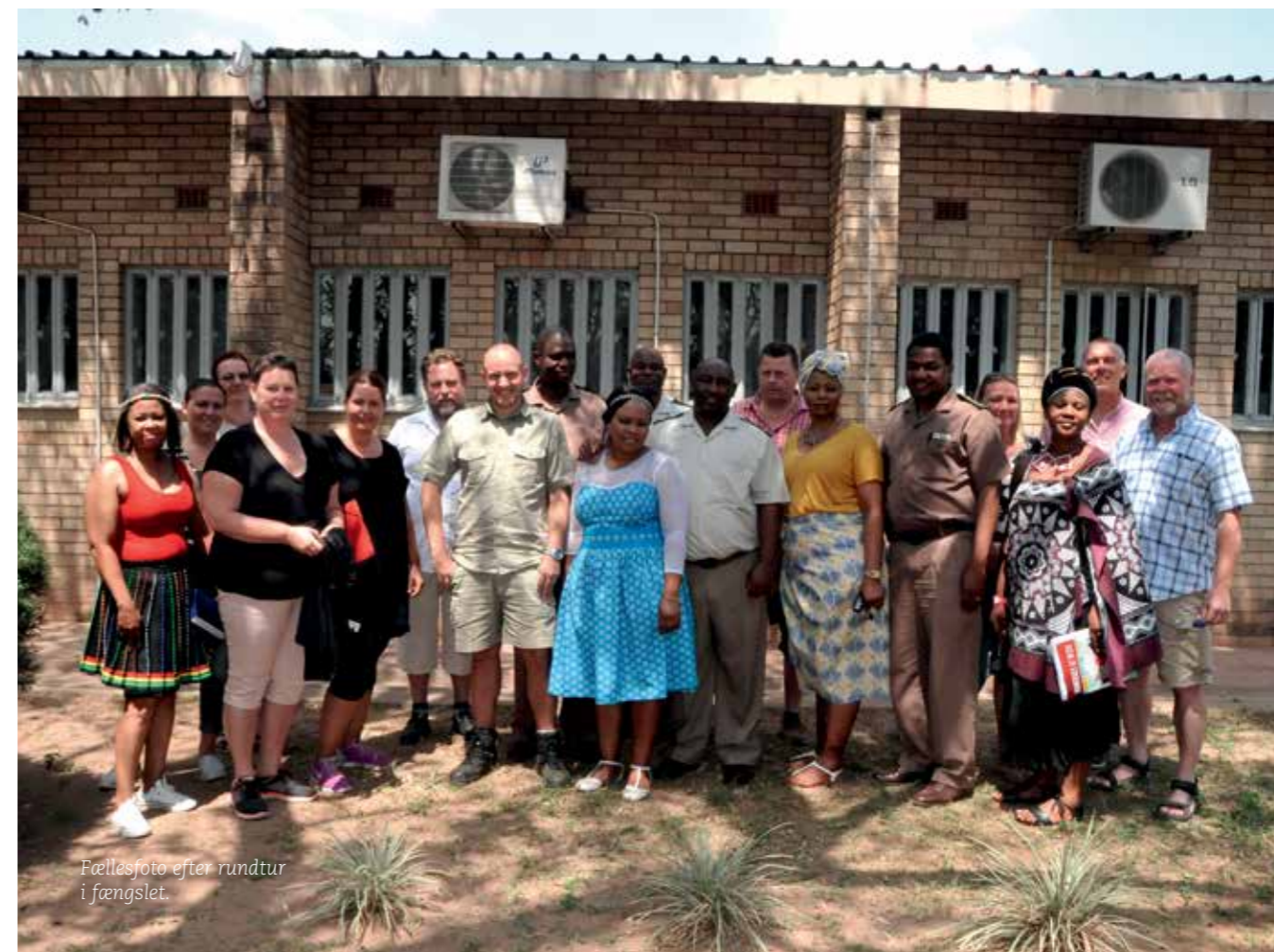
Fællesfoto efter rundtur i fængslet.

Efter 3,5 times rundvisning, information og fællesbilleder fik vi sagt pænt farvel og tak for en fantastisk oplevelse.