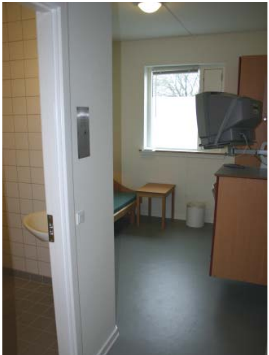
En af de nye celler i nybygningen.