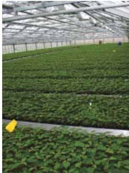
Produktionen af julestjerner på Søbysøgård er i fuld gang.