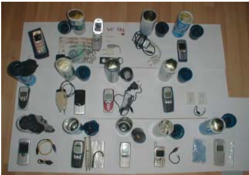
Et samlet billede af barberskumsdåserne og deres indhold.