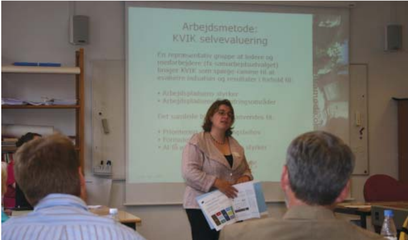
SCKK's workshop om KVIK som værktøj til evaluering af arbejdspladsens stærke og svage sider.

samtidig giver bedre muligheder for at samarbejdsudvalgenes arbejde bliver tilpasset den enkelte virksomhed og afspejler dennes behov. Medarbejdersiden har tillige lagt stor vægt på, at aftalen er blevet mere forpligtigende, med mulighed for sanktioner i form af bod, hvis informationspligten ikke overholdes. Det har samtidigt været vigtigt at der skabes forbedret uddannelse, sikres god rådgivning samt at der sættes fokus på udviklingen.