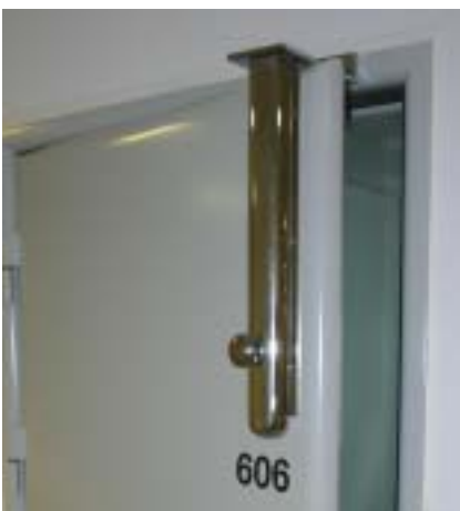
Døren til observationscellen er forsynet med en særlig sikkerhedslås.