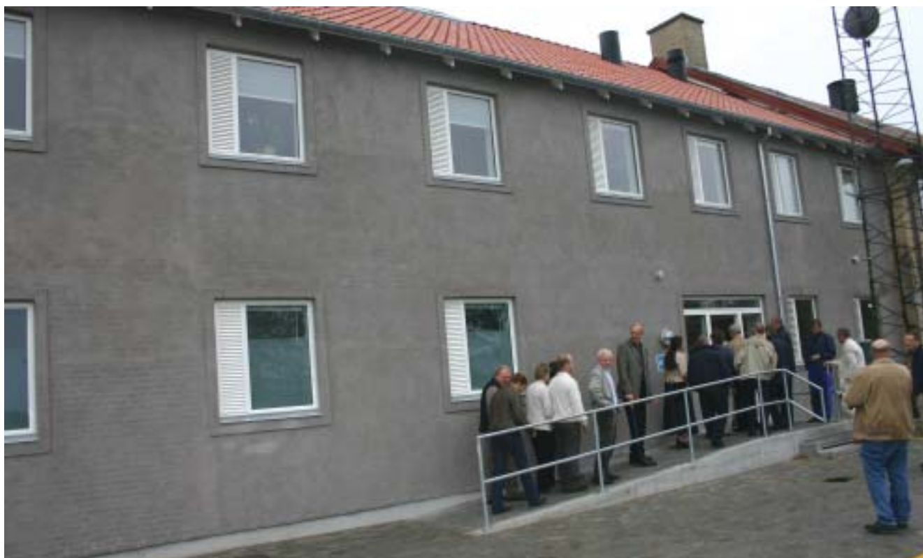
Gæsterne på vej ind til rundvisning i nybygningen.

Efter ombygningen råder fængslet nu over 26 halvåbne og 108 åbne pladser. Cirka en tredjedel af de indsatte er beskæftiget ved drivhusgartneriet, der i