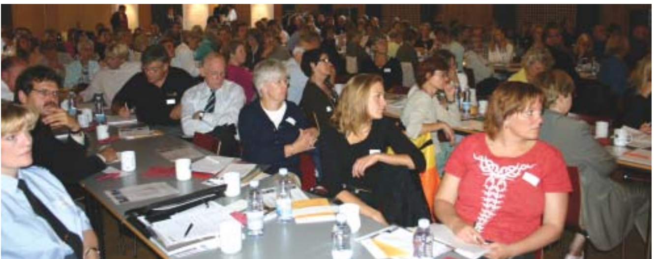
Der var stor interesse for temadagen i København.

Det har været vigtigt for både Personalestyrelsen og CFU at den nye aftale er en forenkling af reglerne, der