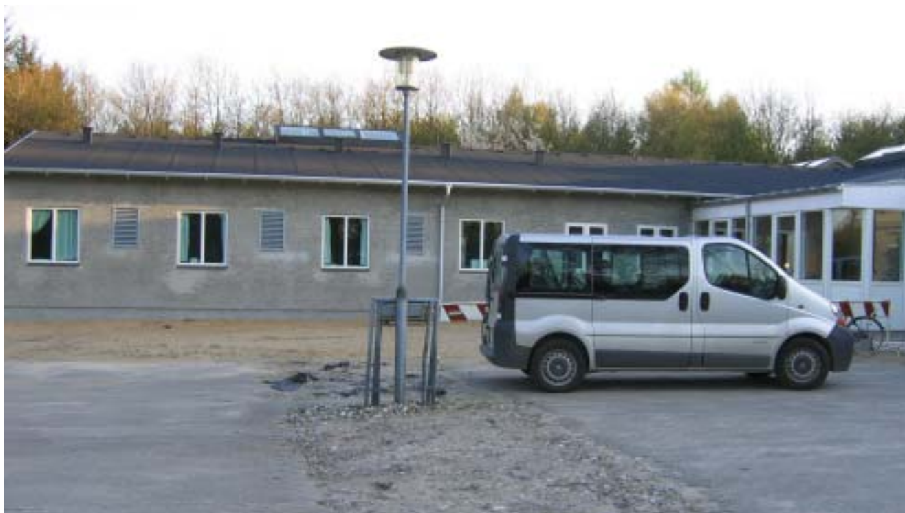
Den nye arresthusfløj og centralvagt i Sønder Omme.

Når man kommer til centralvagten i Sønder Omme, er det første man får øje på byggerod og håndværkerbiler med tilhørende redskaber.