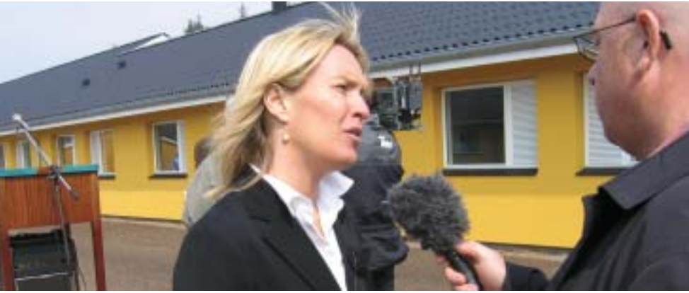
Justitsminister Lene Espersen interviewes ved indvielsen af de nye fængselspladser.