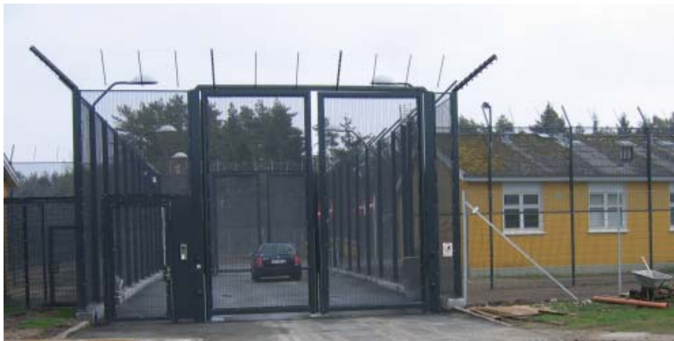
Porten til den lukkede afdeling.

En flot dag at indvie på. Det er mandag den 2. maj 2005 og klokken er 12.30. Solen skinner fra en skyfri himmel, forårsblæsten holder heller ikke fri.