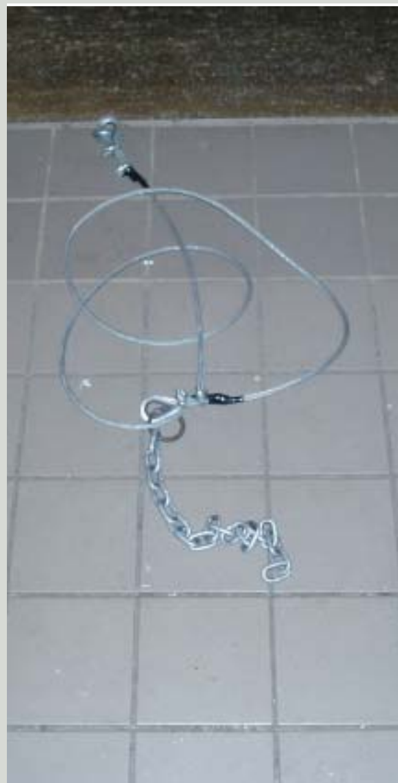
Her ses et af de våben, der blev inddraget efter episoden.

Hvor burde det egentlig være vidunderligt, at være chef og have så prægtig en stab. Tror egentlig aldrig jeg ville blive træt af at rose dem og gøre alt hvad der stod i min magt for at forbedre deres vilkår. Jeg ville gribe enhver chance for at få såvel god som "dårlig" presseomtale. Presseomtale jeg ville kunne bruge til at lægge pres på politikerne eller hvem der nu måtte bestemme. Tror jeg ville gøre alt for at vinde mine ansattes respekt, frem for mine foresattes. ■