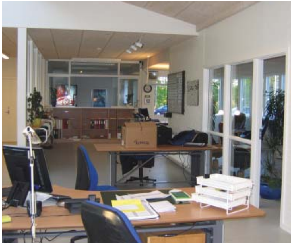
Af Lis Vig Centralvagt og modtagelse er indrettet i lyse og arbejdsmiljøvenlige omgivelser.

Den nye centralvagt har nu fungeret et par måneder og i det store hele er der tilfredshed med resultatet. Der er foretaget et par små justeringer undervejs, og det fortsætter måske lidt endnu - for et er teori og tegning, et andet er praksis og funktion. ■