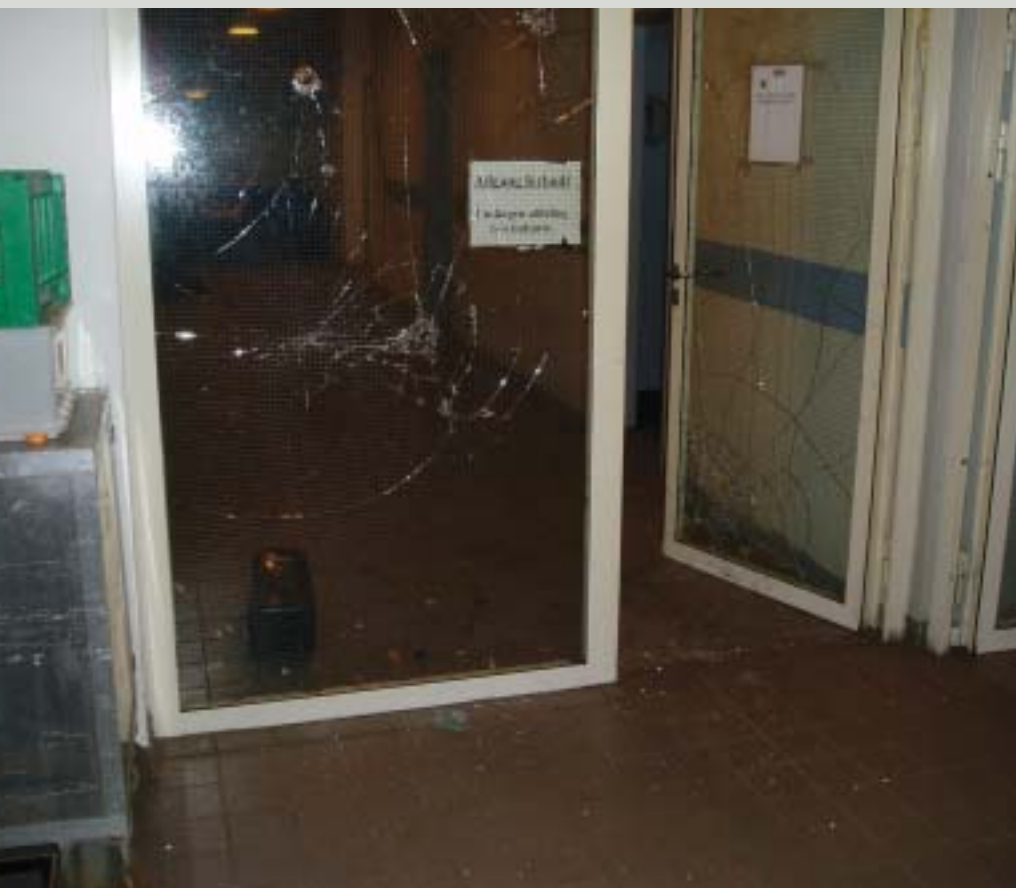
Døren ind til afdeling G blev voldsomt medtaget under oprøret i fængslet.

Åbenbart var hele episoden udløst af et epilepsianfald, der havde nødvendiggjort en indlæggelse med ambulance af pågældende indsatte. Den indsatte havde på intet tidspunkt orienteret personalet om sin epilepsi og havde da heller ikke medbragt medicin til dette. Der havde åbenbart været foretaget nogle undersøgelser på sygehuset umiddelbart forinden indsættelsen og indsatte var derfor ikke blevet medicineret endnu. Men trods det faktum, at den pågældende indsatte nu var tilbage fra sygehuset og sad i god behold på sin stue, så begyndte rygterne at cirkulere. Aktiviteten blandt de indsatte tog stadig til og mindre delegationer gik fra afdeling til afdeling. Et større antal havde ved 15-tiden taget opstilling foran afdeling A, hvor de forlangte at få en overvagtmeester i tale. Hurtigt blev en talsmand valgt