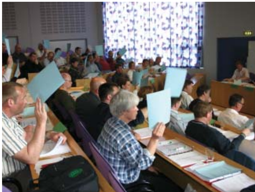
En enig kongres vedtog at optage Fiskeridirektoratets Tjenestemandforening som afdeling under Dansk Fængselsforbund.

en anden StK-medlemsorganisation, Farvandsvæsenets Funktionær Forening.