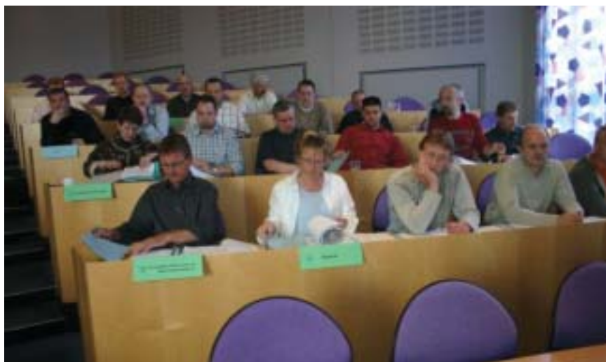
De delegerede på plads i salen ved den ordinære kongres.

Det ene var de stadig flere arbejdsopgaver fængselsfunktionærerne bliver dænget til med. Det andet var de netop overståede overenskomstforhandlinger. Det tredje var arbejdsmiljøet. Og det fjerde var konsulentundersøgelsen og