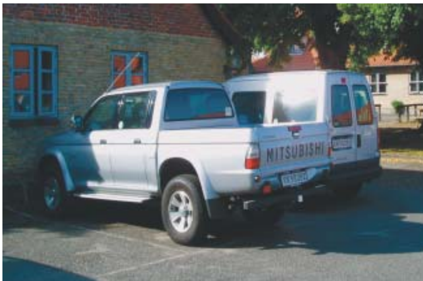
Fængselsafdelingens samlede vognpark består af to køretøjer.

Det var meningen, at fængslet skulle fyldes af indsatte med færdselslovsovertrædelser og domme af kortere varighed. Nu er det således, at virkelig mange af de tilsagte afsonere gives udsættelse til senere afsoning af landets politimestre. Det gør det totalt umuligt at styre belægget, og for at få fyldt fængslet op, er der kørt adskillige biler med afsonere fra de øvrige åbne fængsler til Lange-land. Flere af disse indsatte har domme