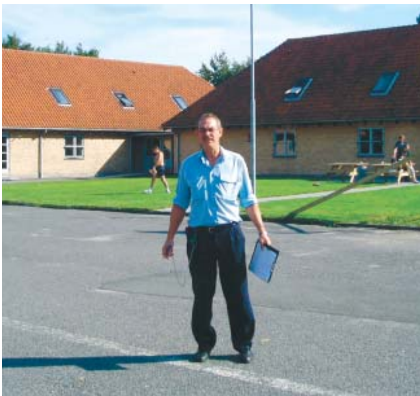
Fængselsfunktionær på vej fra optælling af de indsatte.