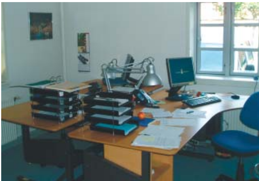
Personale- og sikkerhedskonsulent og overvagtimesterkontoret.

Af Steen Væver, pt. Fængselsafdelingen Langeland