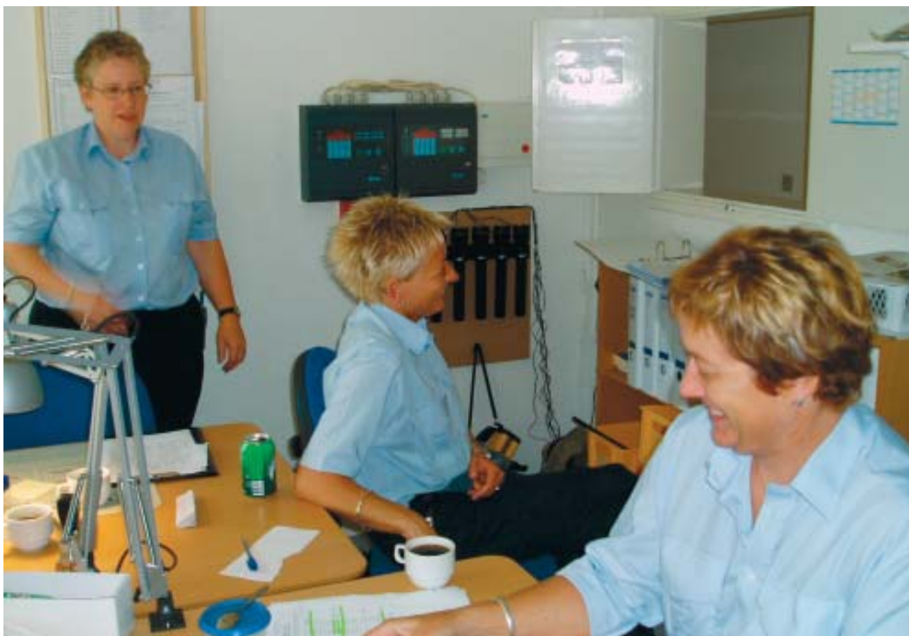
Tre af de ansatte under en pause fra dagens gøremål.