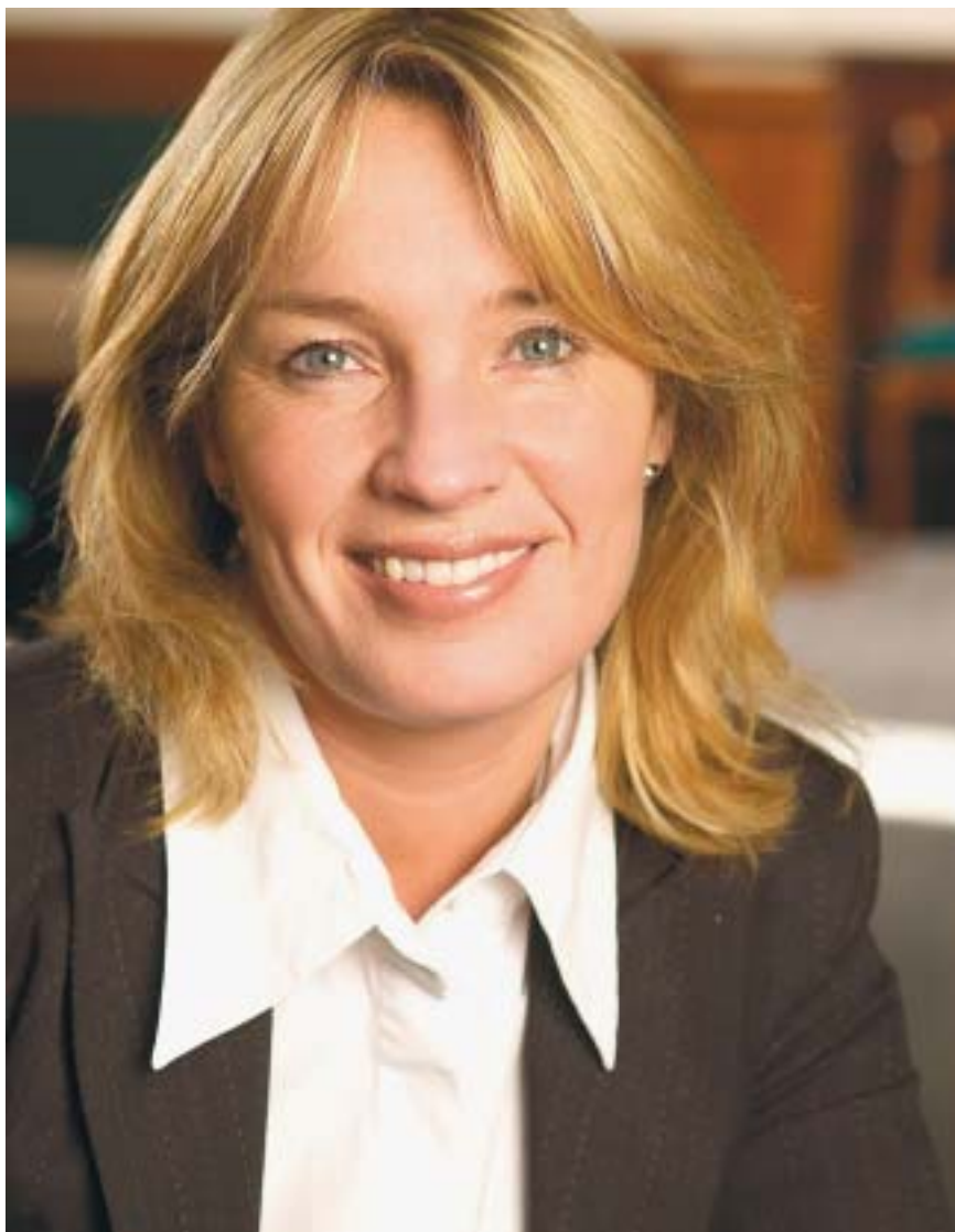
Justitsminister Lene Espersen vil nu sætte hårdt imod hårdt overfor de stærkt kriminelle indvandrerbander.

Ministeren lægger op til, at der på de særlige afsnit kan ske en mandsopdækning af de indsatte, der har tilknytning til de stærkt kriminelle grupperinger såsom Den Internationale Klub, Black Cobra eller lignende. Meningen er, at