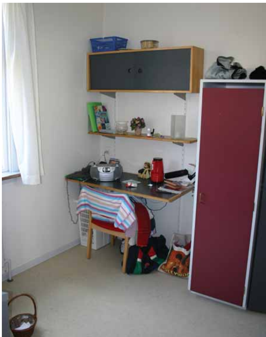
Cirka halvdelen af de personer, der får tilbudt at søge om at afsoner i eget hjem med fodlænke, vælger i stedet at udstå deres straf i en fængselscelle.