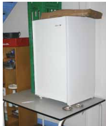
"Køkkenet" i Fængslet på Nytorv.

Til trods for rekord i belægningsprocent vil Langlandsfortet fortsat blive lukket i år, siger justitsministeren.