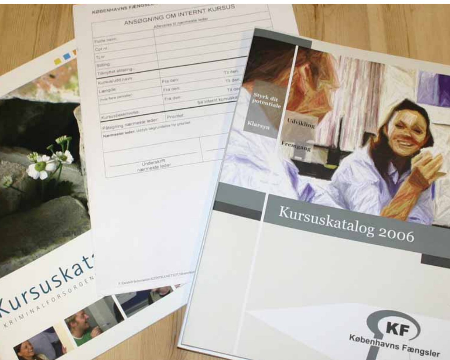
Københavns Fængsler kursuskatalog for 2006 giver gode efteruddannelsesmuligheder for personalet.