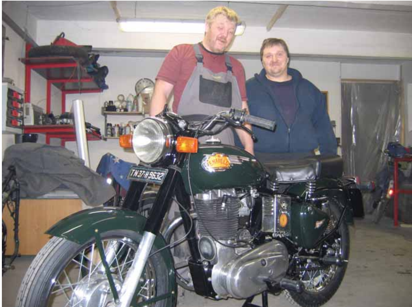
Nogle af FEMMERENs indsatte har gennem længere tid renoveret 3 motorcykler sammen med nogle af fængselsfunktionærerne på afdelingen.

iserende stoffer. Et ambitiøst projekt med et tæt samarbejde mellem fængslets faggrupper og behandlere fra Hjul-søgård blev sat i gang.