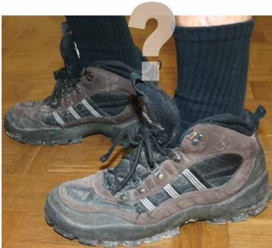
Spørgsmålet er, hvorfor så mange vælger fængselsstraf i stedet for fodlænkeordningen.