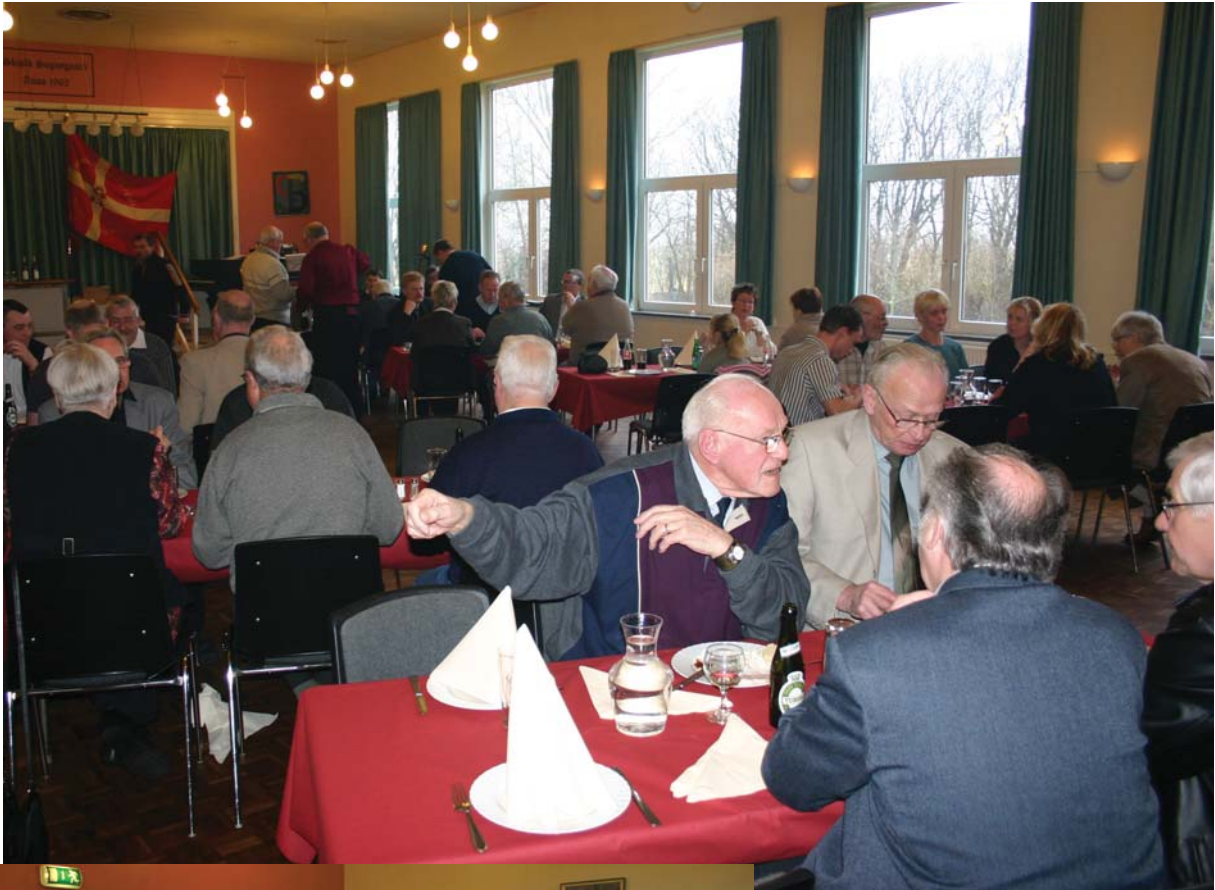
Snakken gik livligt omkring bordene.