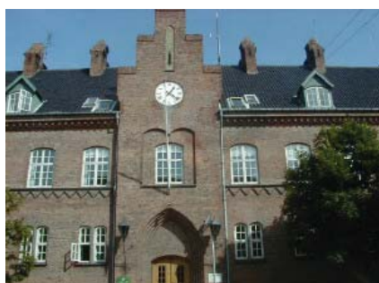
Arresthuset i Nakskov.