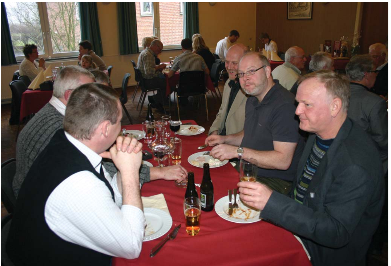
Deltagerne hyggede sig med god mad og i godt selskab.