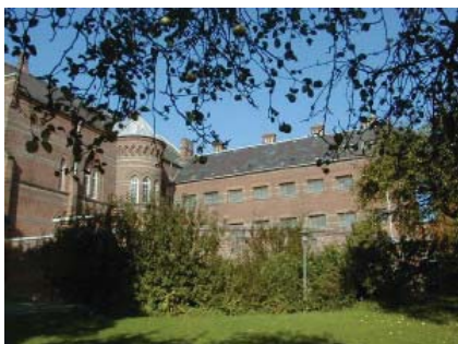
Arresthuset i Svendborg.