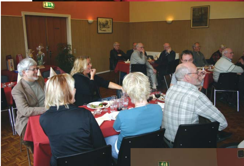
Gæsterne lyttede til lykønskningstalerne.