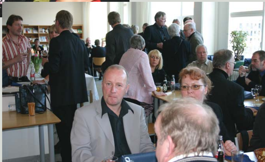
Socialt samvær efter den formelle del af arrangementet.