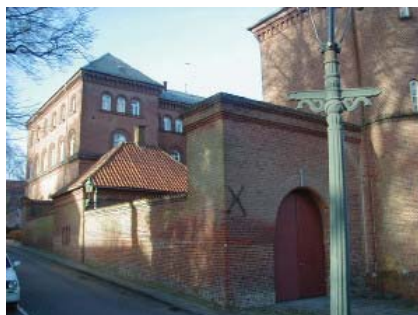
Arresthuset i Viborg.