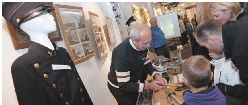
Museumsfolkene viser flugtredskaber, våben og legetøj mm frem.