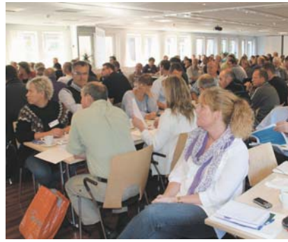
Arbejdsmiljødagen blev afviklet med et stort antal engagerede deltagere fra mange forskellige tjenestesteder.