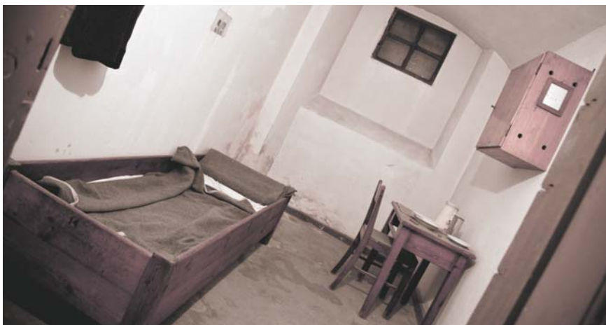
Dagmar Overbyes celle i kælderen under Nytorvs Fængsel.