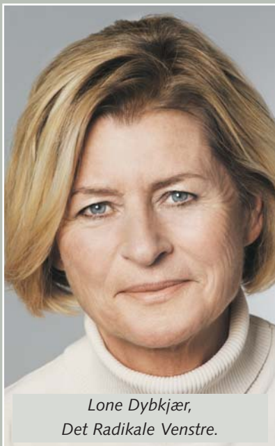
Lone Dybkjær, Det Radikale Venstre.

"Vi skal styrke Kriminalforsorgen på alle punkter. Der er akut brug for flere ressourcer. Der sidder alt for mange i fængsel, og en del af dem skulle slet ikke være der. Det gælder stofmisbrugere og unge under 18 år, som skal have nogle helt andre tilbud. Det koster. De fleste andre lande kan klare sig uden at smide folk i fængsel med straffe på under tre måneder. I langt højere grad skal vi benytte samfundstjeneste, så småkriminelle har bedre mulighed for at slippe ud af kriminalitet. Derudover skal normeringen forbedres markant. Hvis vi får flere fængselsbetjente per indsat, forbedrer vi arbejdsmiljøet her og nu, og giver samtidig langt større mulighed for efteruddannelse."