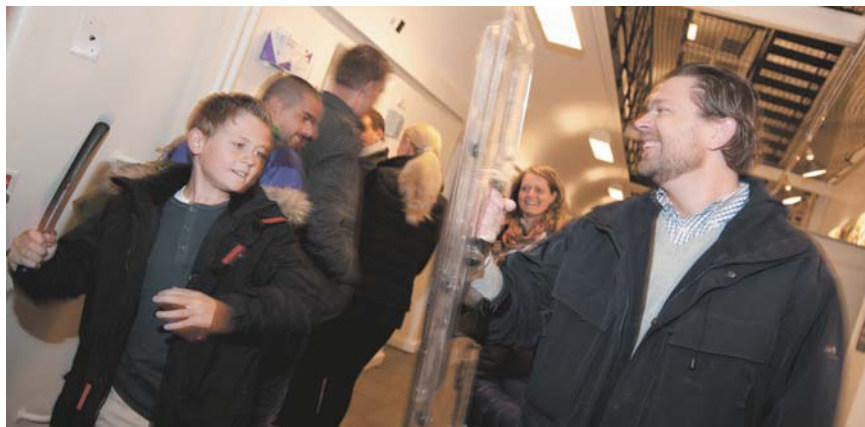
Heldigt at far godt ved hvordan man skal holde på et skjold når han får bank med staven.