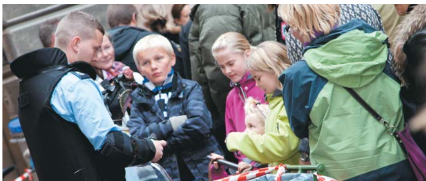
Alle små som store er meget interesseret i "de store mænd" med indsatsudstyret.

Der var også en stor udstilling hvor man kunne se og købe noget af alt det