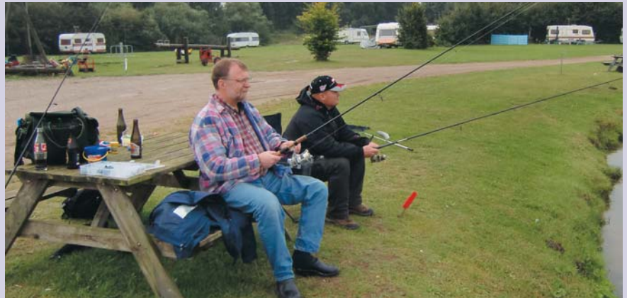
Afslappet fiskeri ved søen.