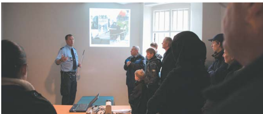
Her fortælles om hvordan narkohundeførerne træner og arbejder.