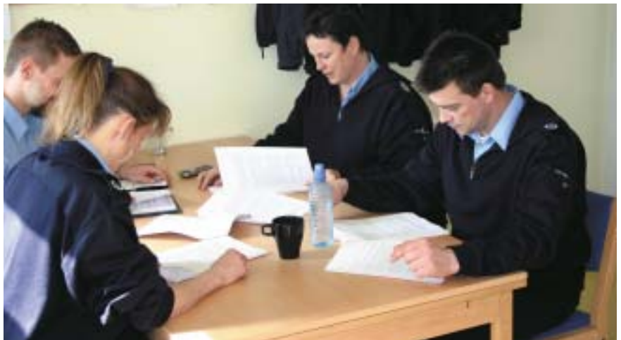
Personalet nærlæser Kammeradvokatens rapport om forholdene på Herstedvester.

Desuden skal der iværksættes høringsprocedurer over for to fængsels-