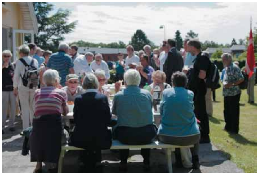
Gæster og venner af foreningen foran museet.