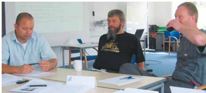
Der var alvorlige sager på programmet.

havde et godt tilbud til personalet på sygeafdelingen, og en del andre i fængslet. Et kursus på tre dage om behandlingen af psykisk syge og misbrugere. Der var tale om et pilotprojekt i AMU regi.