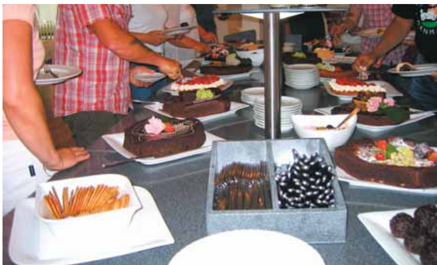
Et kaffebord der ikke stod tilbage for det berømte sønderjyske.

I øvrigt understregede underviserne, at særligt i forhold til suicidaltruede er det vigtigt at følge både det lærte og ens samvittighed og intuition. I denne forbindelse kunne man så lære, at ved en depression er det vigtigt at huske, at selvmordstanken almindeligvis ikke udføres under den dybeste del af depressionen, men først når personen er på vej op igen og dermed har fået lidt mere energi. Ret tankevækkende, at vi ser indsatte anbragt under særlig observation, fordi de virker dybt deprimerede og taler om at tage deres eget liv. Når vi så har talt lidt med dem, og de har fået en smøg og er begyndt at savne deres egen celle og fjernsynet, så lukker vi dem ud igen, for det siger straffuldbyrdesloven, at vi skal. Anbringelsen må jo som bekendt ikke udstrækkes ud over hvad formålet tilsiger. Men nu er han måske lige netop blevet energisk nok til at tage livet af sig. At det så ikke sker flere gange end tilfældet er, skyldes, at vi har en god intuition og indlevelse. Hvis man ellers skal tro underviserne.