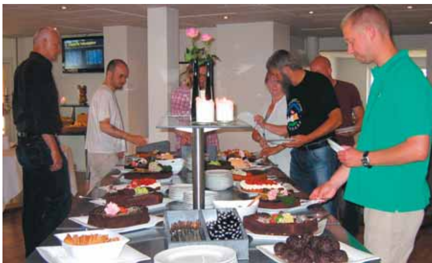
Her vil vægttab være selvforskyldt.