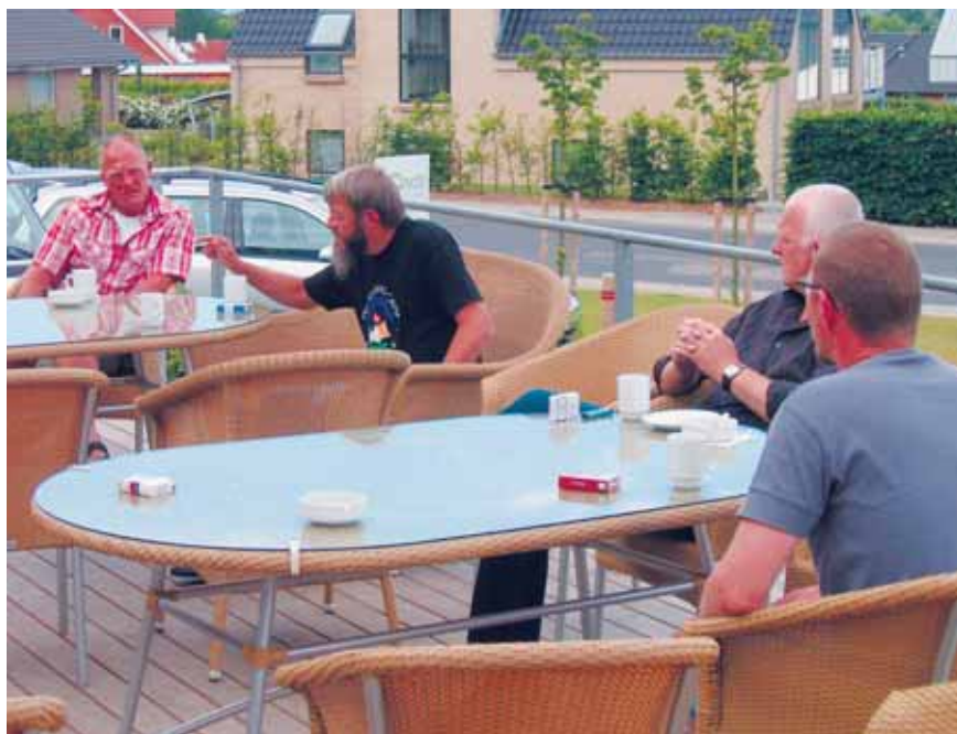
Engagement og opmærksomhed er i top allerede ved morgenkaffen.

Et andet eksempel på redskaber, som vi allerede anvender, men som blev formuleret og sat i system, er spørgsmålet om plat eller virkelighed. Vi kender til det ulidelige situationen med den indsatte, der virker komplet sindssyg, psykotisk, deprimeret, væk fra vinduet, eller hvad