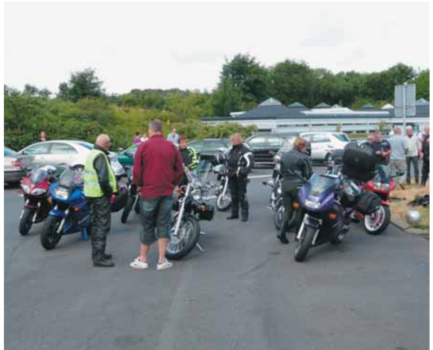
Opsamling i Hylkedal.

Efter at have provianteret drog vi af sted i herligt vejr, som først blev lidt vådt lige før vores ankomst til den gamle herregård der dannede rammen om arrangementet.