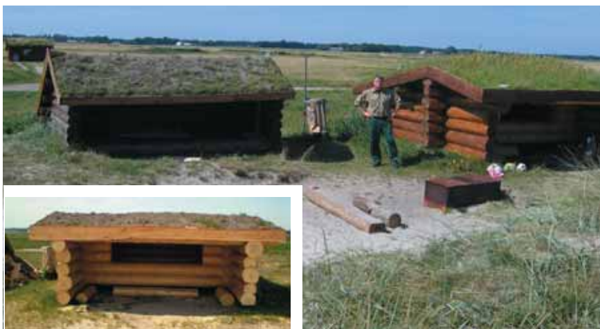
De to sheltere på stranden.

bænkesæt til både børn og voksne, strandstole/bådstole, andehuse og rede- kasser til brug i jagtforeninger, træ til plankeværk og bygninger, hvor af en del er brugt på fængslet til terrasser, byg- ninger og andre formål. Foruden lærke- træ indgår kirsebærtræ og egetræ også som en del af skovhugsten. Og det er jo