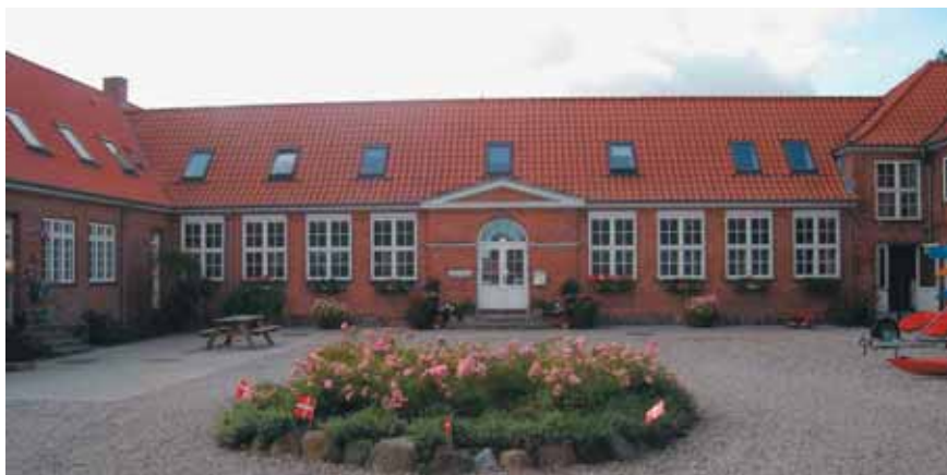
Den gamle landsbyskole fra 1931, som i 2001 blev til Kontrakt pensionen Fyn.

misbrugere ud i samfundet, når de blev løsladt fra en kontrakt afdeling på et fængsel, og derfor var der et behov for at etablere en kontrakt pension som udslynings- og behandlingsinstitution.