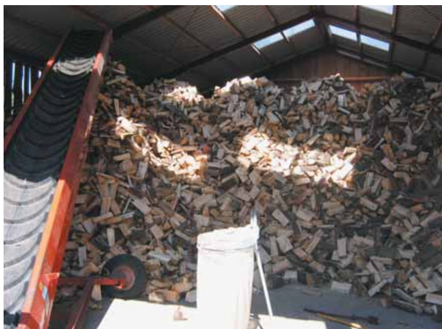
Et lille udsnit af brændelageret.