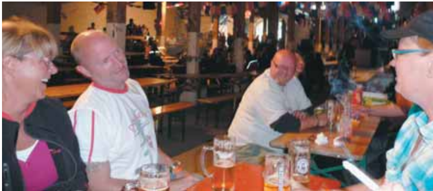
Hygge i campen og i laden.