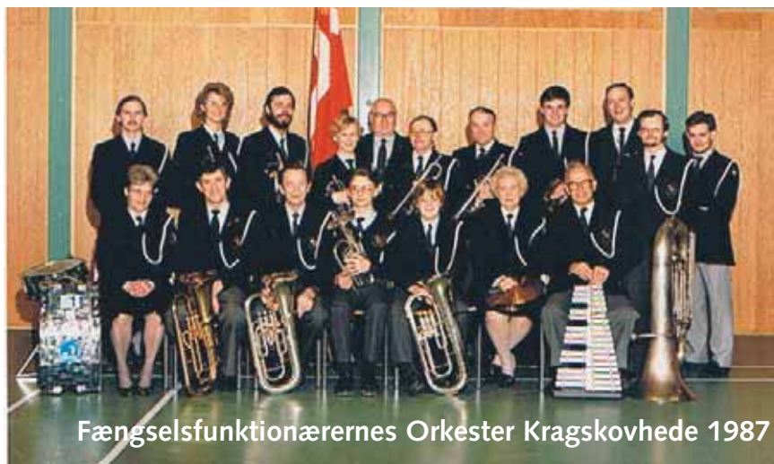
Fængselsfunktionærernes Orkester Kragsskovhede 1987