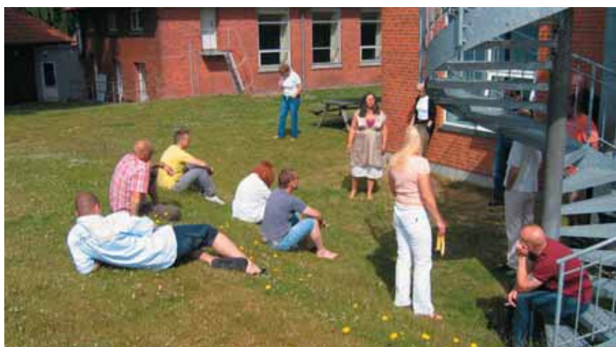
Restitution i fri luft.