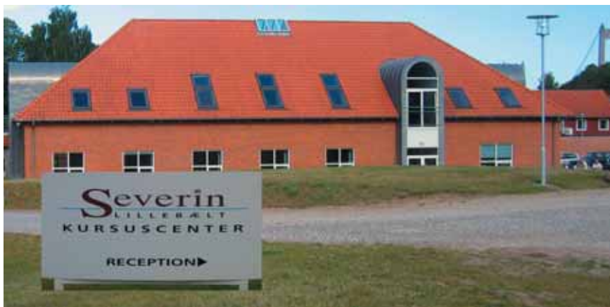
Det var her det skete.

Det var ikke en kendt jysk kludekræmmer, men derimod P/S konsulenten, der