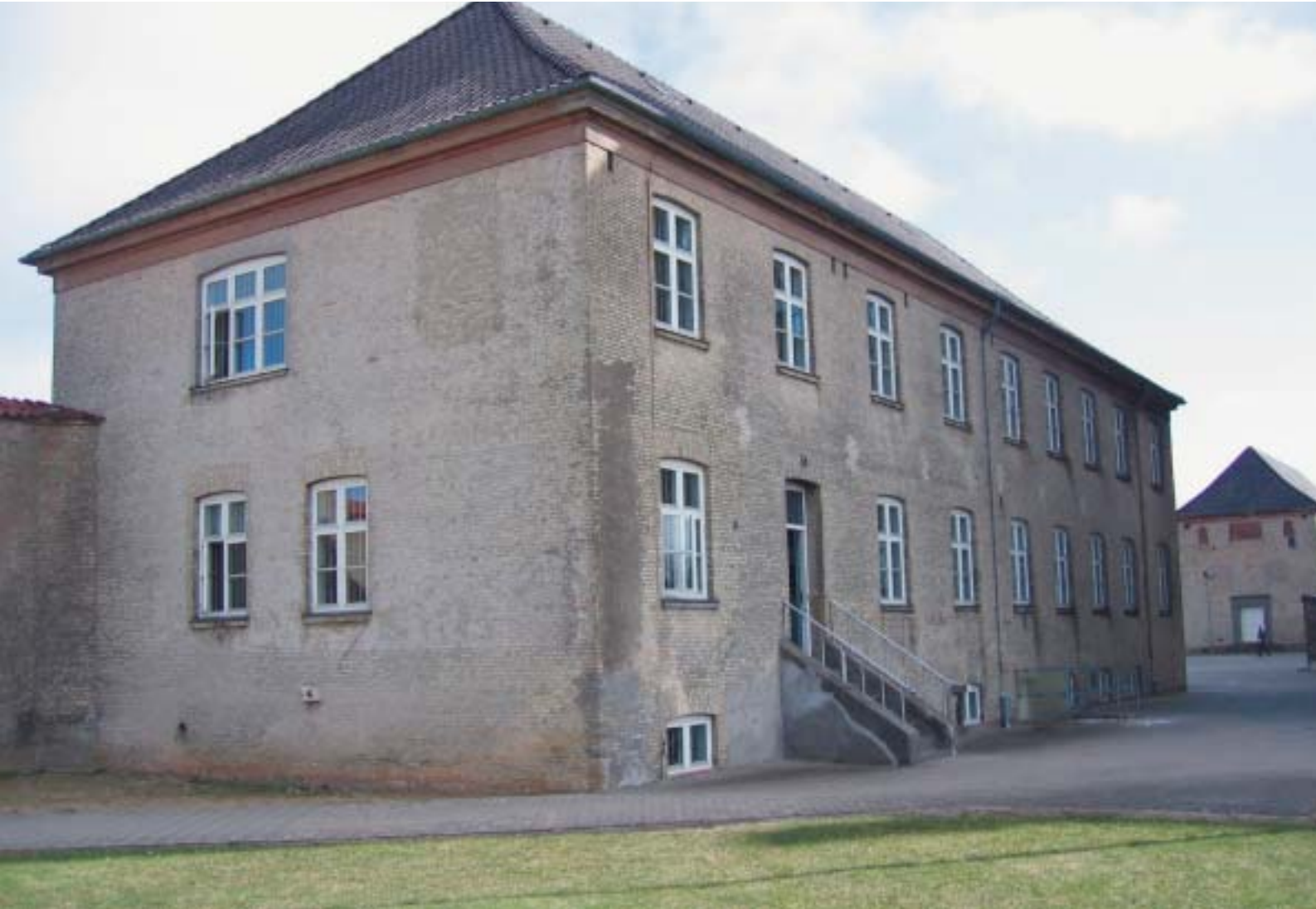
Bygningen hvor den nye behandlingsafdeling er etableret