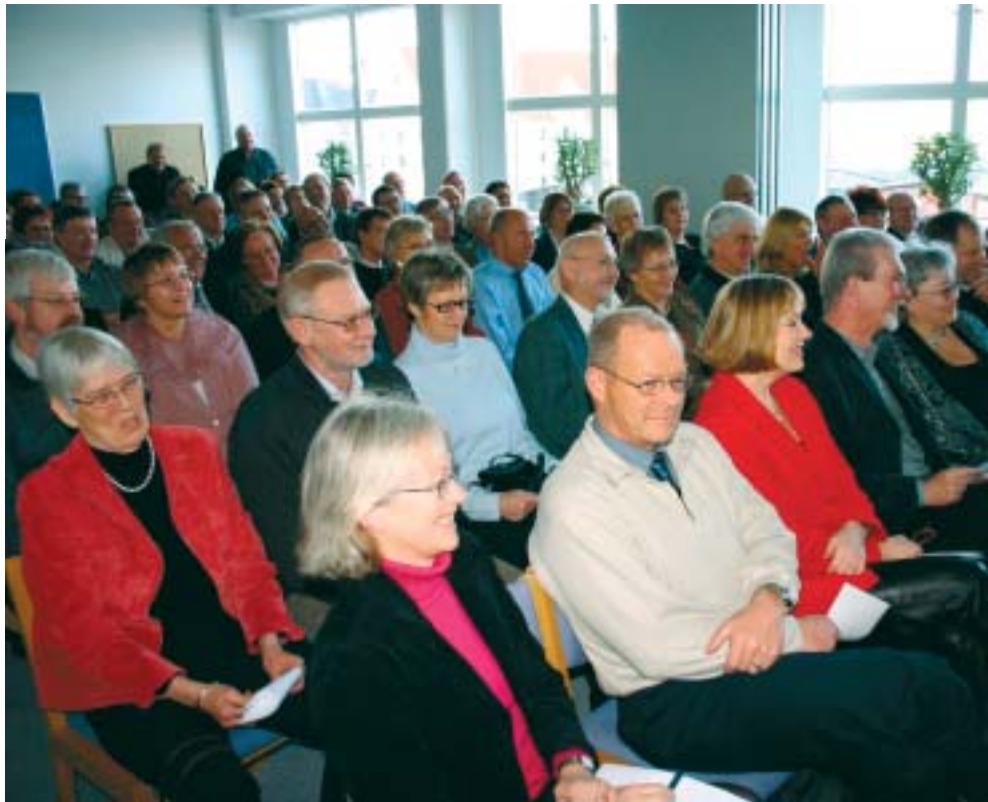
Deltagerne morede sig over de sjove indslag

"Jeg synes at det var et alle tiders arrange-