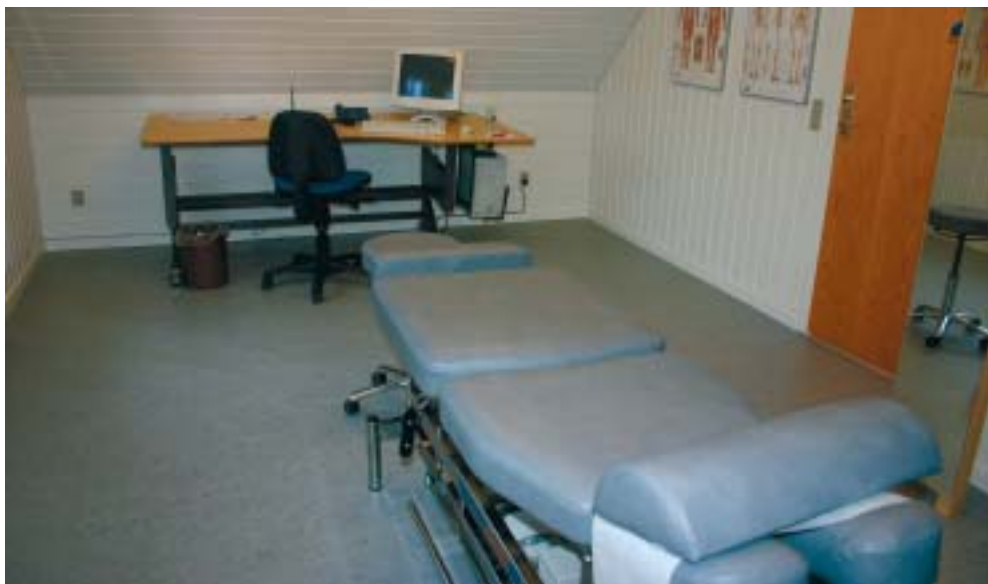
Den nyoprettede klinik på Kærshovedgård, hvor personalet kan få kiropraktorbehandlinger, fysio- og zoneterapi samt massage.

På Fængselsafdelingen Kærshovedgård har man den senere tid fokuseret målrettet på at skabe en række forbedringer af personaleforholdene. Der er nu iværksat en sundhedsordning for medarbejderne og man er i fuld gang med at omdanne en tidligere lejebolig til et personalehus. Derudover er det planlagt at oprette en fælles personalekantine.