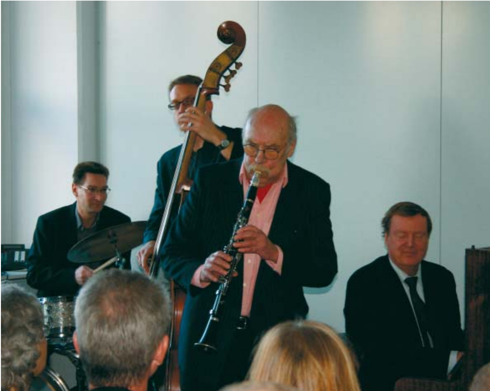
Espresso Kvartetten stod for en del af underholdningen.

kunne se lidt nærmere på Direktoratets fysiske indretning.