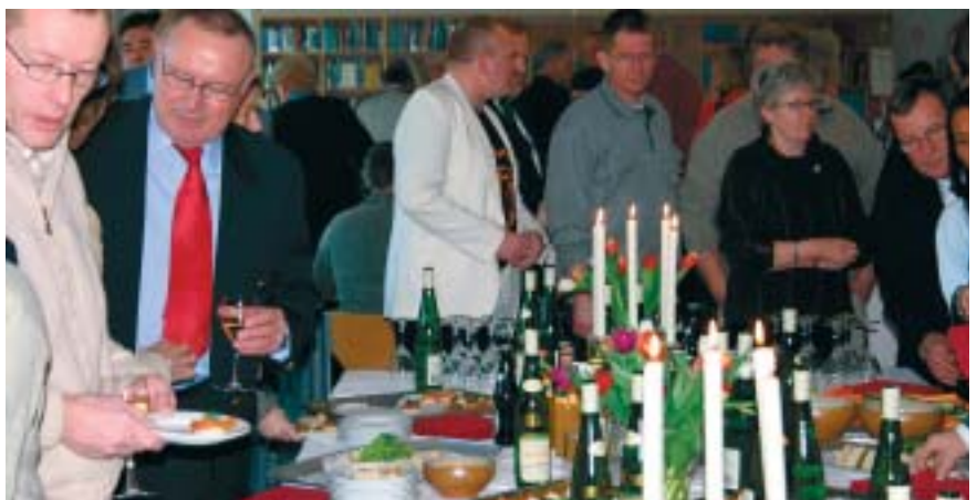
Der var trængsel ved buffeten.