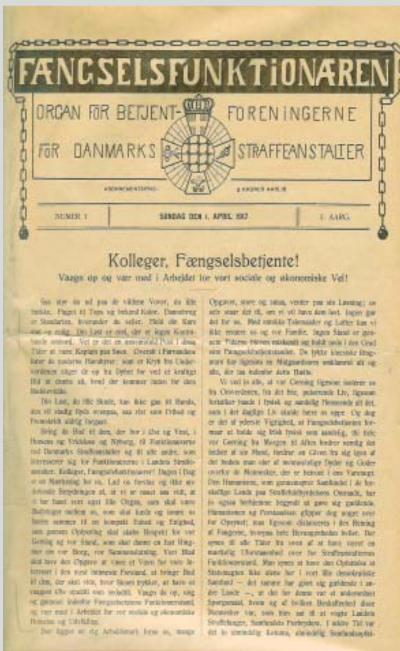
Her ses første nummer af Fængselsfunktionæren. Indholdet i det står ikke til at ændre, men du kan være med til at præge debatten i fremtiden.