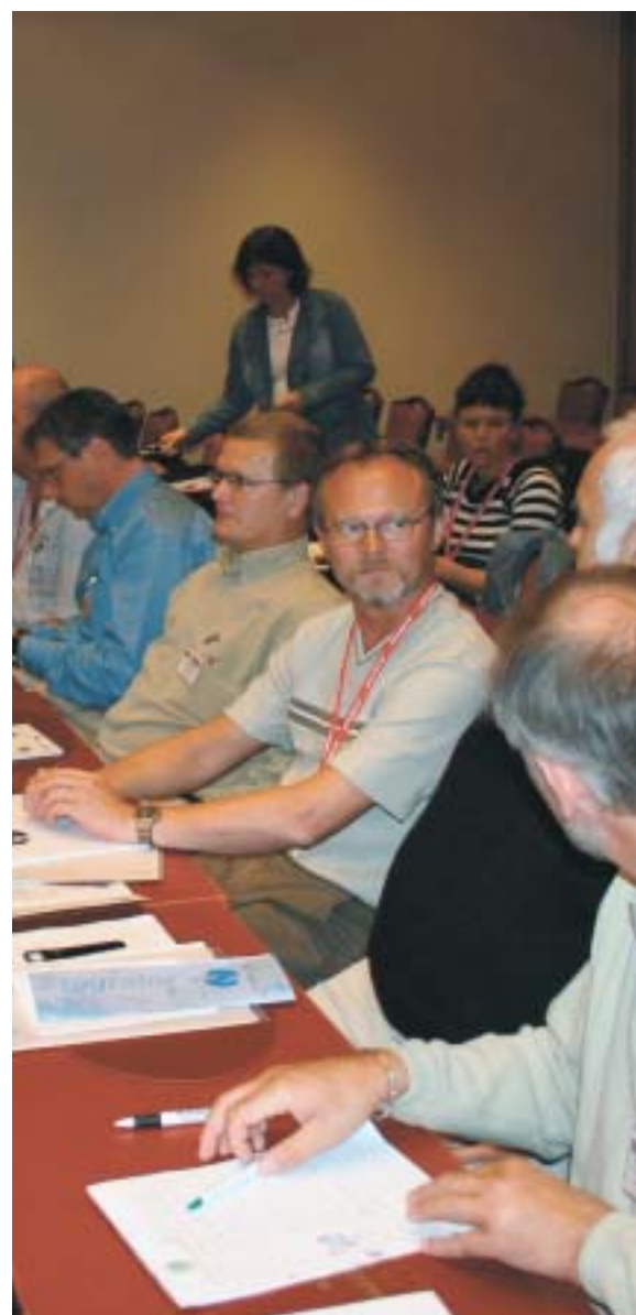
Repræsentanter fra Dansk Fængselsforbund i konferencsalen.

NFU opfordrer myndighederne til handling !