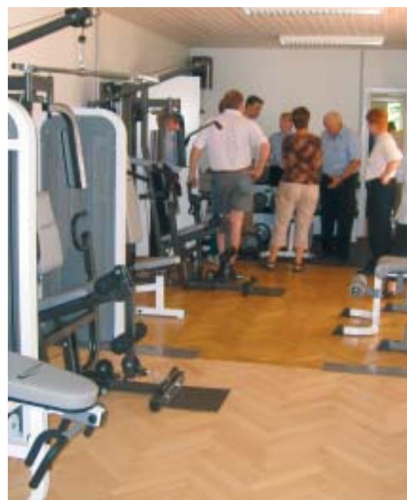
Gæsterne ser på nogle af de nye maskiner.