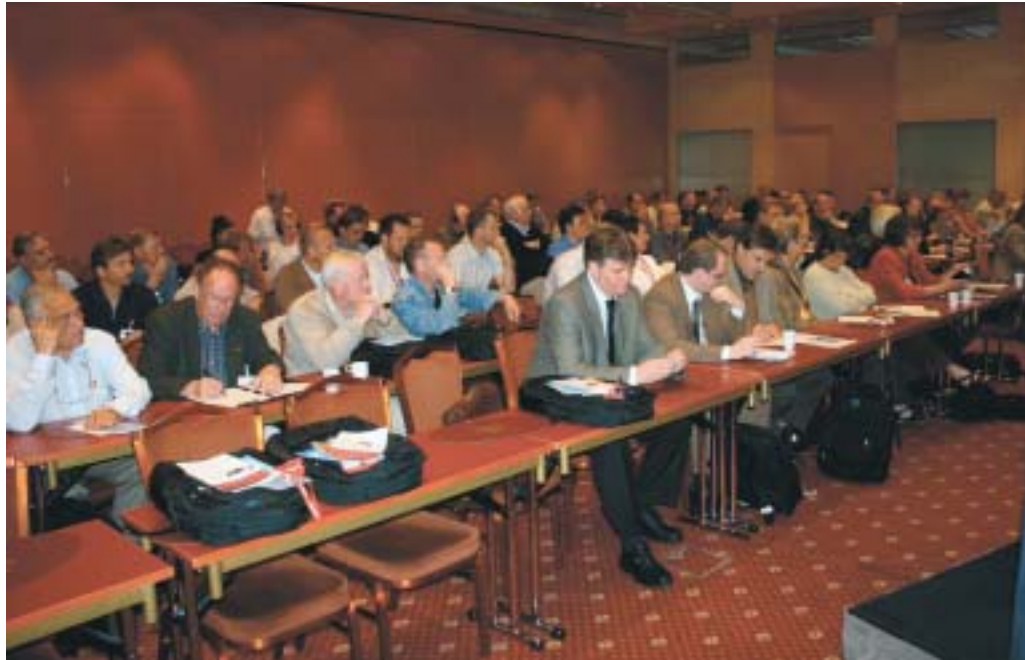
Med deltagelse af over halvfems personer, var NFU-mødet det største, der har været afholdt i dette regi.