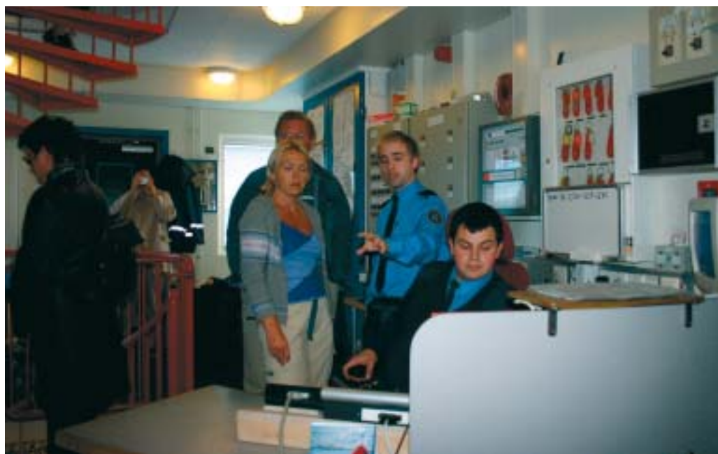
Centralen hvor personalet primært opholder sig og hvorfra de udfører kontrol af de indsatte ved hjælp af kameraovervågning.