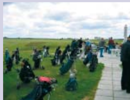
Bag parkering ved fi's første Golfstævne.

fi tager de forskellige forslag til efterretning, og det vil indgå i overvejelserne i forslaget til regulativet for Golf, som vil blive drøftet på Repræsentantskabsmødet i oktober måned 2004.