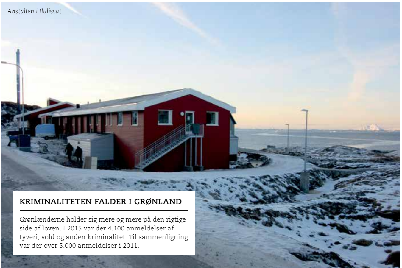
Anstalten i Ilulissat