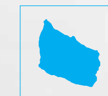
Institution Københavns Vestegn og Bornholm