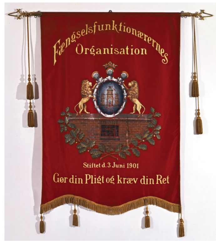
Banneret stammer fra 1909, da den københavnske organisation ændrede navn fra Arrestfunktionærernes Organisation til Fængselsfunktionærernes Organisation.

Københavns Magistrat, der i sidste ende var arbejdsgiver for arrestbetjentene, kunne ikke godkende den ønskede lønforhøjelse på 1.200 kroner stigende til 1.400 kroner om året for dagbetjente. Magistraten kunne kun gå med til en mindre forhøjelse for betjente, der havde under 1.000 kroner om året.