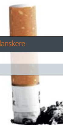
Fig. 5. Fire gange så mange er storrygere – sammenlignet med andre danskere